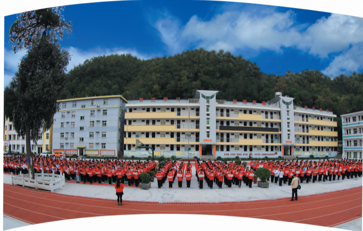
“全国教育系统先进集体”马安镇初级中学