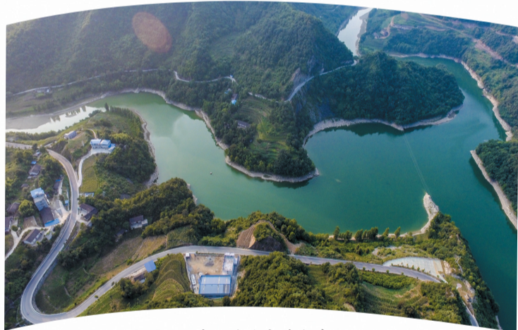
美丽的马安关水库