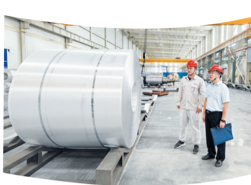
建行十堰分行客户经理走访企业。