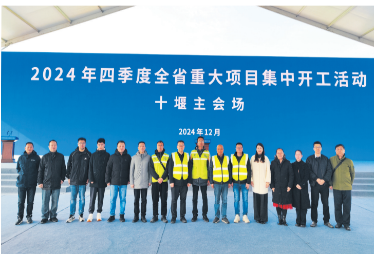
中国电信完成2024年四季度重大项目集中开工通信保障任务。