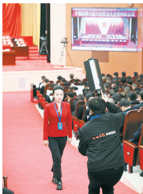
媒体记者现场报道。