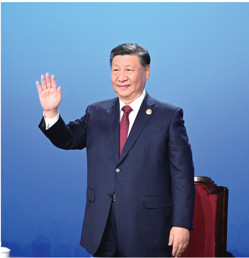
二月七日晚,第九届亚洲冬季运动会在黑龙江省哈尔滨市隆重开幕。这是国家主席习近平在主席台上向大家挥手致意。