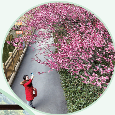
微风拂面飘然至，一片清新把客留。拍摄于市人民公园。

梅花的绽放，不仅为城市增添了一抹亮丽迷人的色彩，更象征着这座城市在新的一年里蕴藏着无限希望与蓬勃活力。