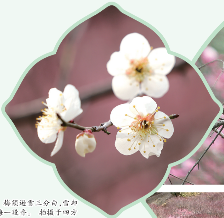
梅须逊雪三分白，雪却输梅一段香。拍摄于四方山植物园。