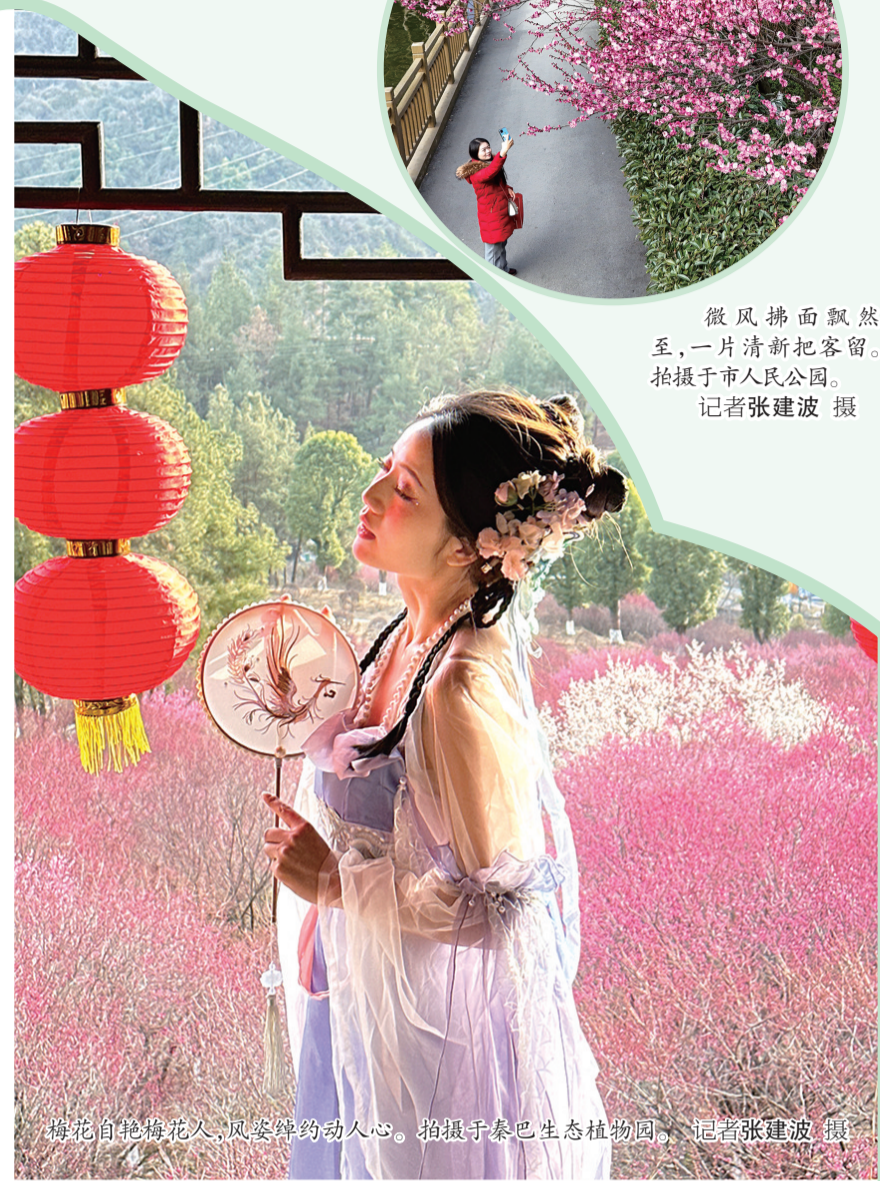
梅花自艳梅花入，风姿绰约动人心。拍摄于秦巴生态植物园。