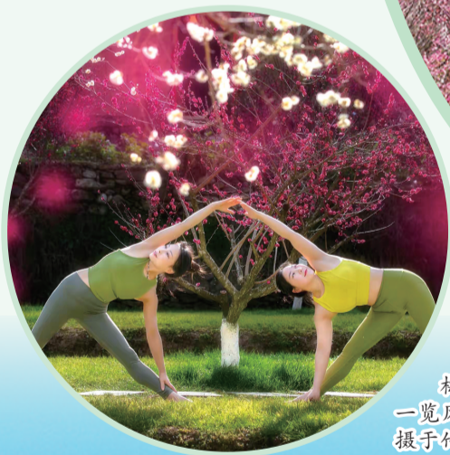
梅花映日开，远客慕芳来。一览风光后，争相韵律裁。拍摄于竹山太和梅花谷。通讯员王国忠 摄

丹江口市城区江边梅园: 在丹江口大坝下游汉江两岸，有长约一公里的梅花带，万株梅花怒放，与滔滔汉江交相辉映。