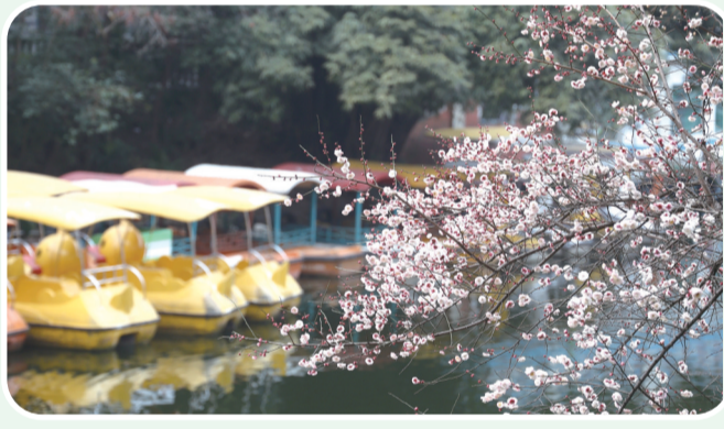
绽放的红梅与静谧的湖泊相映成趣。