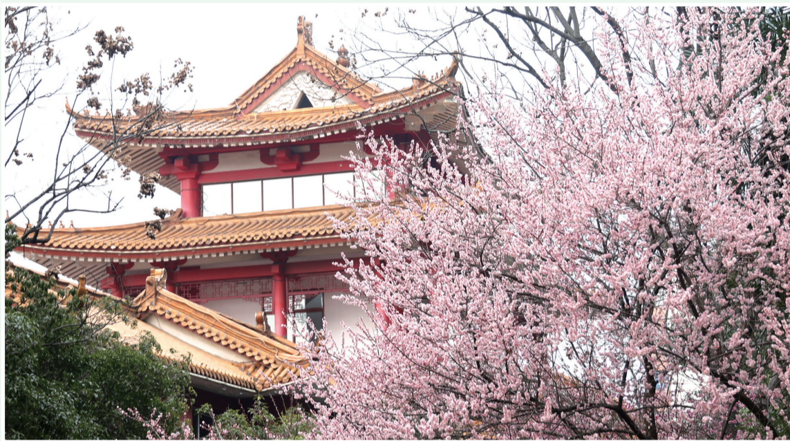
红梅与远处的园林建筑相互映衬,构成一幅美丽的画面。

“我们聚焦人民群众美好出行需求,汇聚新时代高质量发展‘开路先锋’强大合力,为城乡融合发展增添强劲动力,让农业因路而兴、农村因路而美、农民因路而富。”市交通运输局主要负责人说。