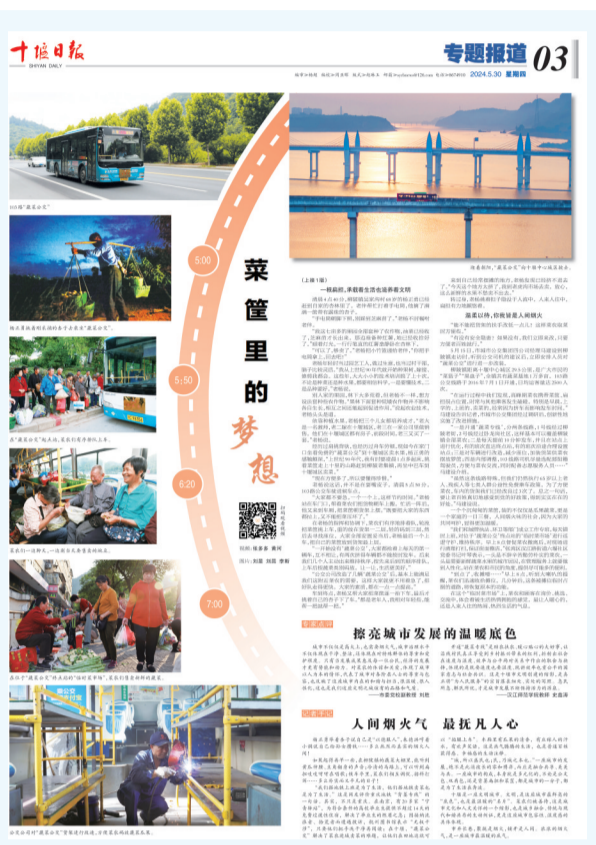
《十堰日报》2024年5月30日3版