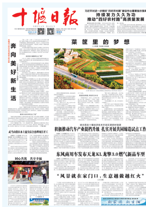
《十堰日报》2024年5月30日1版

城市治理是一个复杂的课题,其难度不仅体现在跨部门协同的宏观调配上,更体现在管理服务的“最小颗粒度”上。“蔬菜公交”一头连接的是不辞辛苦、勤劳朴实的菜农,另一头连接的是需要新鲜蔬