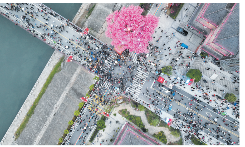
桃花源街区的醒目地标桃花树。

去年2月,该县对原国际绿松石城商业街区进行改造升级,打造一条集观光休闲、餐饮住宿、特色演艺等功能于一体的大型沉浸式综合性文旅街区——桃花源街区。该街区于当年5月1日开街,一举成为新晋文化旅游胜地,引来无数游