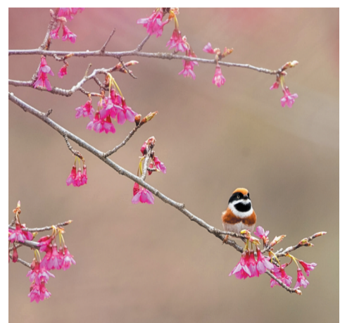
四方山植物园里早樱绽放。