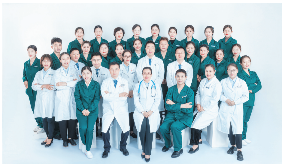
国药东风总医院肾脏内科团队。

凭借过硬的实力,科室于2019年被命名为“省级临床重点专科”,2024年再次获此殊荣。自2022年起,医院以肾脏内科、器官移植科、泌尿外科为整体,打造集医疗、教学、科研于一体的“全周期肾病诊疗旗舰”,成功创建湖北省肾脏病