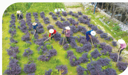
官山镇西河村兴建花卉苗木基地。