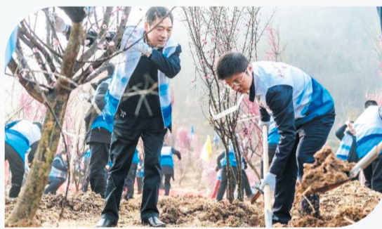
“小水滴”志愿者积极参加义务植树活动。

漫步丹江口库区堤岸,去年种下的树苗已发出新芽,目之所及皆是生机盎然。这抹跃动的绿意背后,藏着2024年林业人交出的硬核答卷——完成病枯死松树清理23万余棵;沿库区岸线、公路铁路、石漠化荒山等重点区域,高标准完成义务植树150万株、四旁植树120万株,营造林任务13.28万亩……春风拂过这里,生态家园画境更胜。