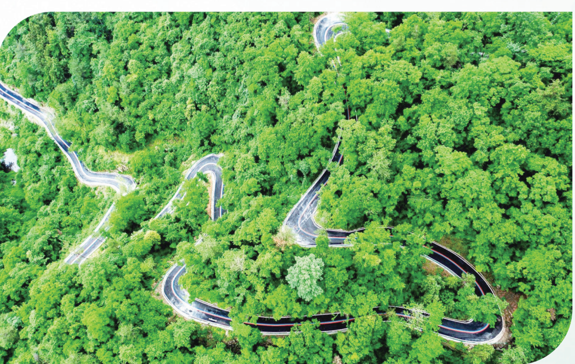
白杨坪林区植被茂密

丹江口市林业部门锚定“两山”转化创新实践,以产业建设为纽带,在活绿增效中书写生态富民新篇章。