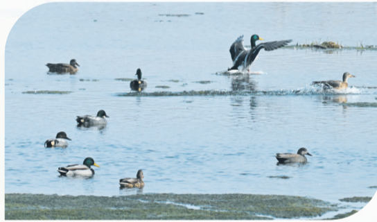
丹江口大坝下游沧浪洲湿地公园水鸟栖息。