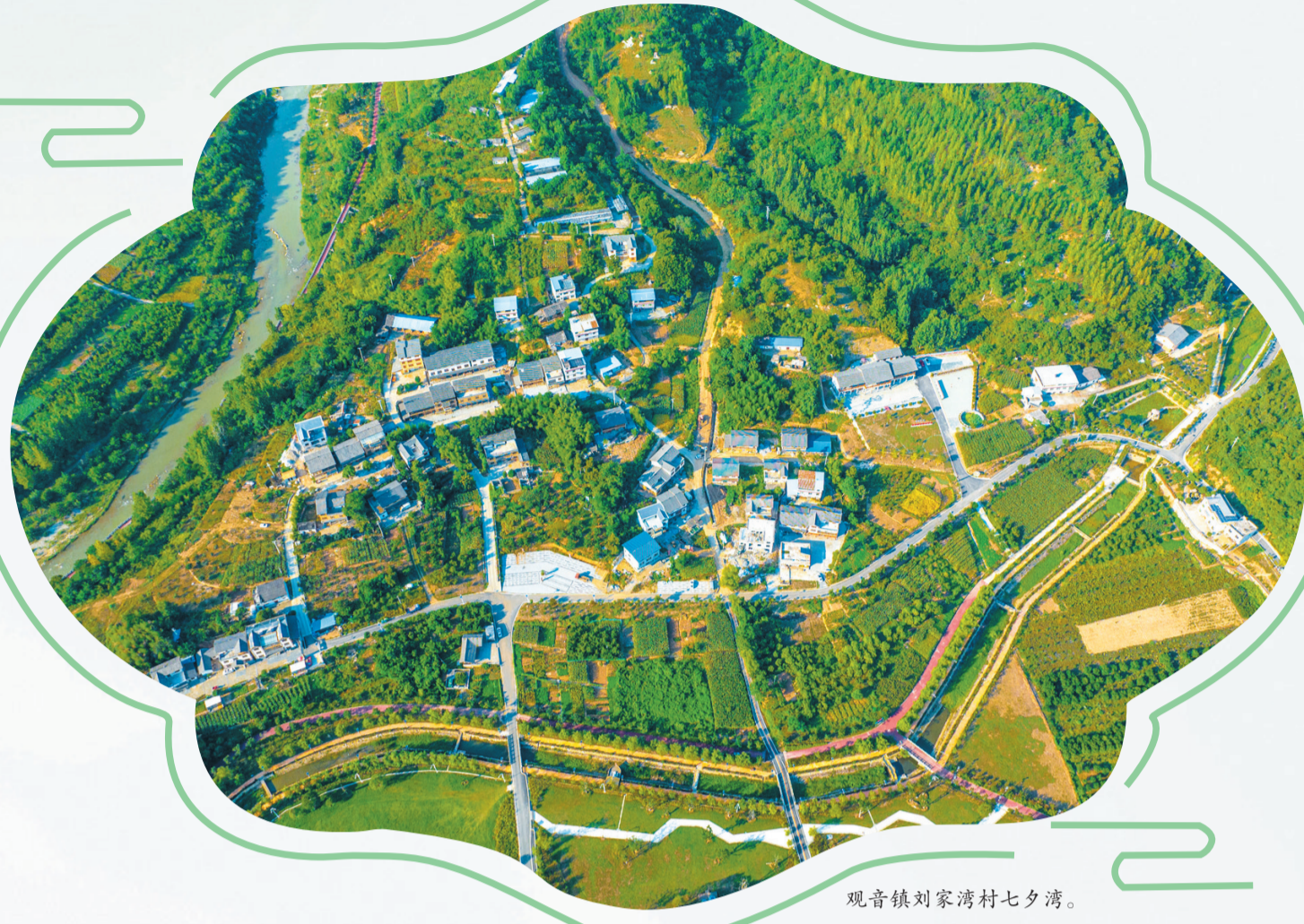
观音镇刘家湾村七夕湾。

近年来,郧西县林业系统坚定践行“绿水青山就是金山银山”理念,秉持“三绿”并举、“四库”联动的发展思路,以林长制为抓手,深耕国土绿化、森林资源管护与林业产业发展,描绘高质量发展的生态底色,让“多彩郧西”焕发全新活力。2024年,郧西县林业局被省林业局授予林业科技宣传和信息化先进单位,被市林业局授予全市林业工作先进单位,被郧西县委、县政府授予高水平保护先进集体。