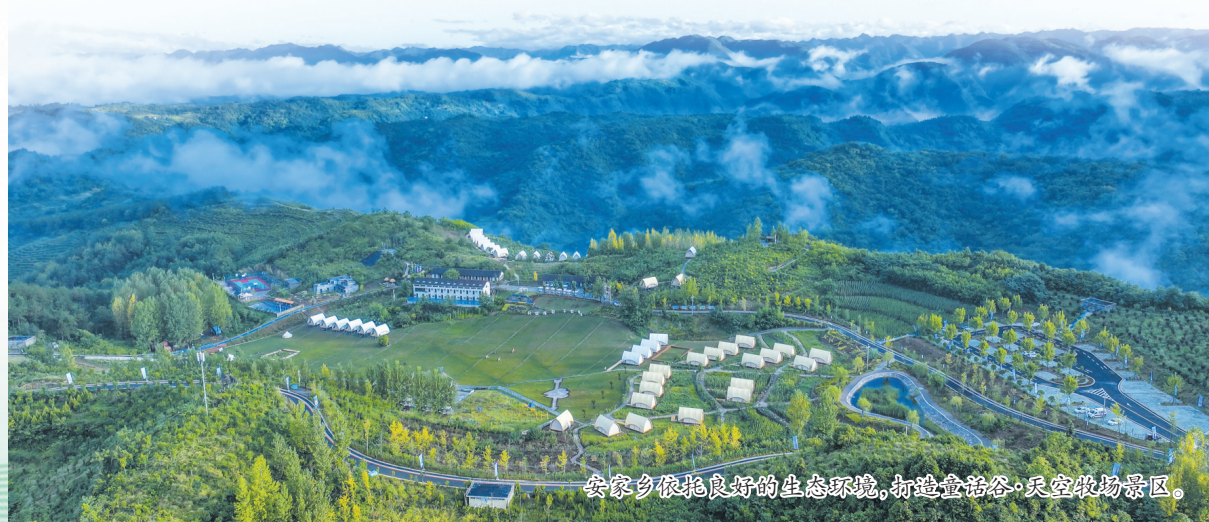
安家乡依托良好的生态环境,打造童话谷·天空牧场景区。