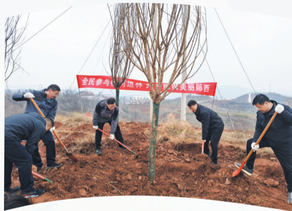
郧西县委副书记参加义务植树活动。