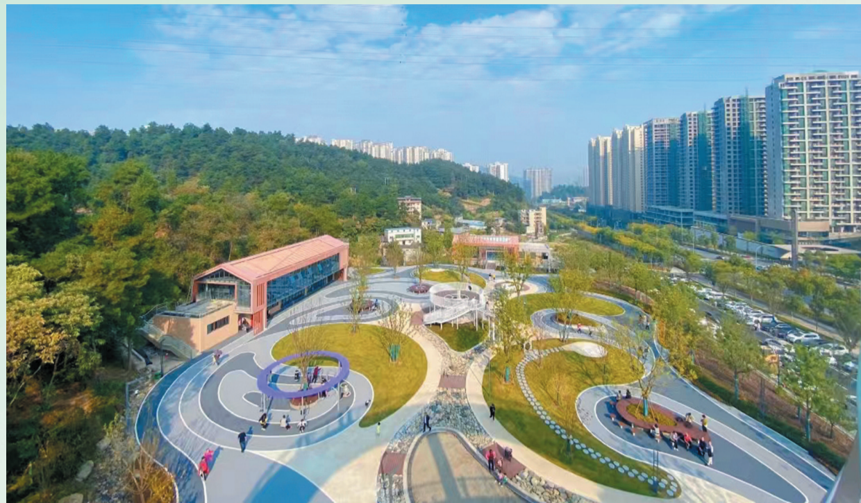
城在绿中,人在景中。

三月的张湾,青山含黛,林木吐翠,春意盎然。记者驾车驶入西沟乡,只见沿路绿荫织锦,游客在大自然的怀抱中惬意享受“张湾绿”生态福祉。