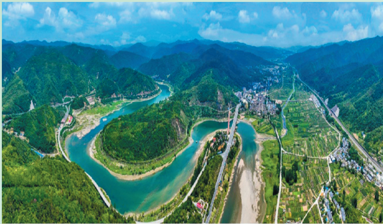
绿树成林,生态宜居。