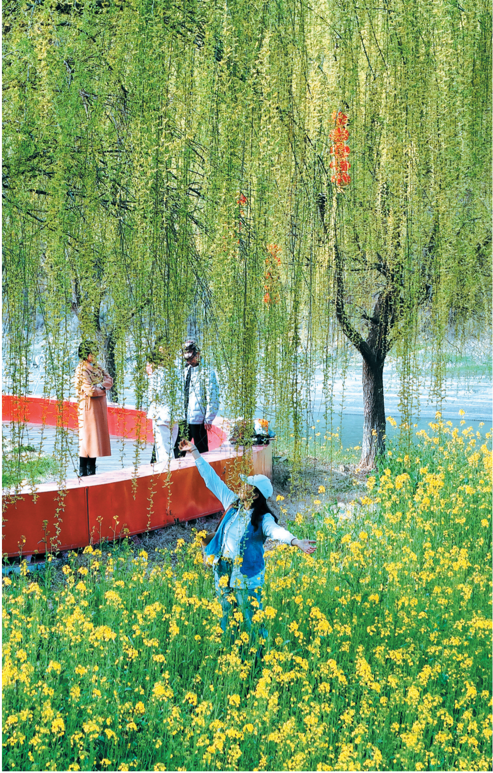
杨柳千条拂面丝,绿烟金穗不胜吹。拍摄于张湾区方滩乡。