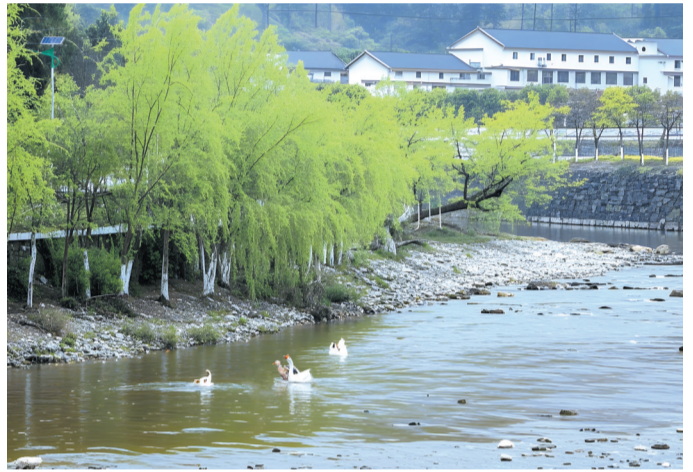
鸭戏清波绿柳树,风吹细雨湿花枝。拍摄于郧西县关防乡沙沟村仙河畔。

无论在城区还是乡村,十堰的垂柳执绿色的画笔,勾勒出一幅幅美丽的画卷,用灵动的音符,奏响了一曲曲春天的赞歌。