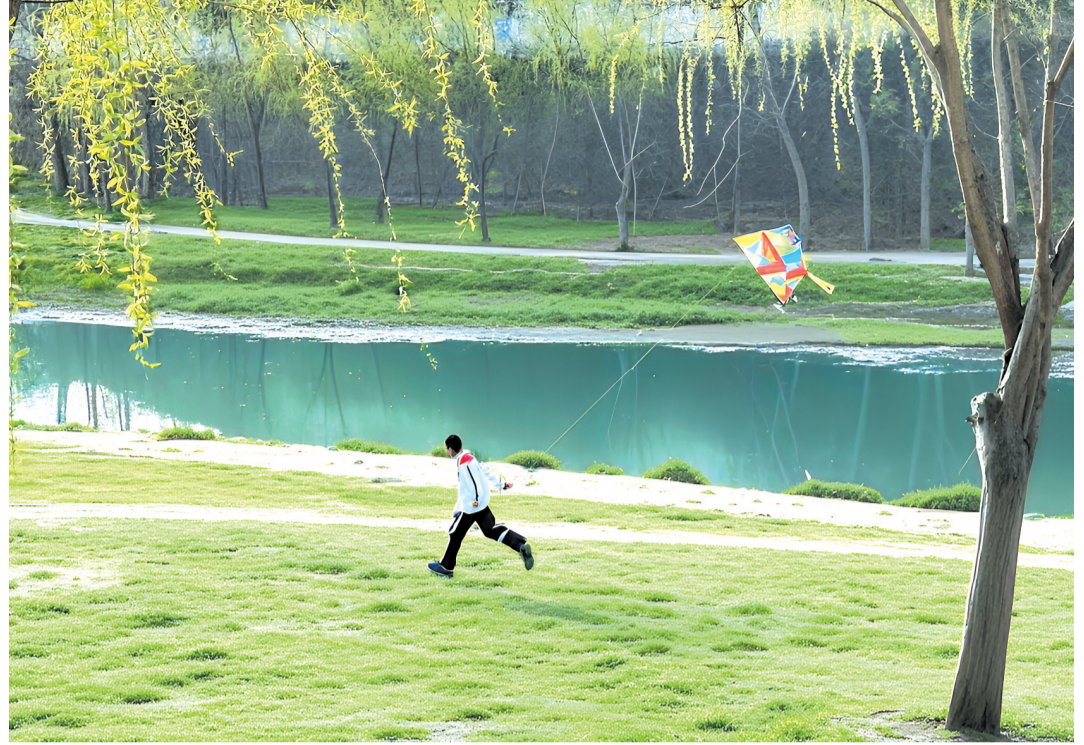
儿童放学归来早,忙趁东风放纸鸢。拍摄于张湾区汉江路街道神定河河道。

惊蛰过后,春意渐浓。晨光漫过武当山脊时,汉江正将城市的倒影细细碾碎。十堰早春的垂柳悄然卸去寒枝,初绽鹅黄的嫩芽,在春风中舒展成千万条绿丝丝,将一冬的留白点染成水墨丹青。