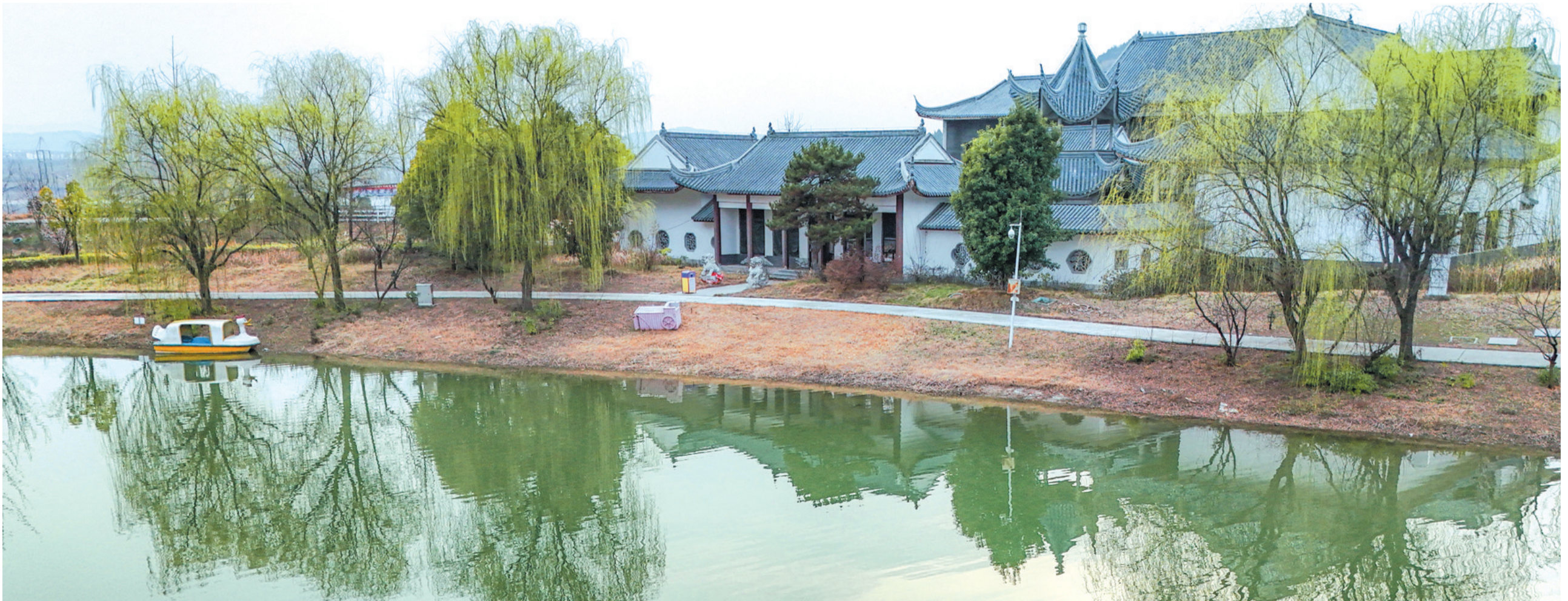
柳条百尺拂银塘,且莫深青只浅黄。拍摄于郧阳区子胥湖景区。