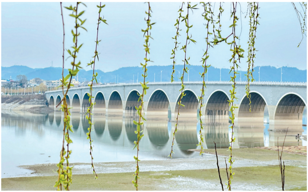
河桥柳,占芳春,映水含烟拂路。拍摄于郧阳区柳陂镇郧阳湖畔。