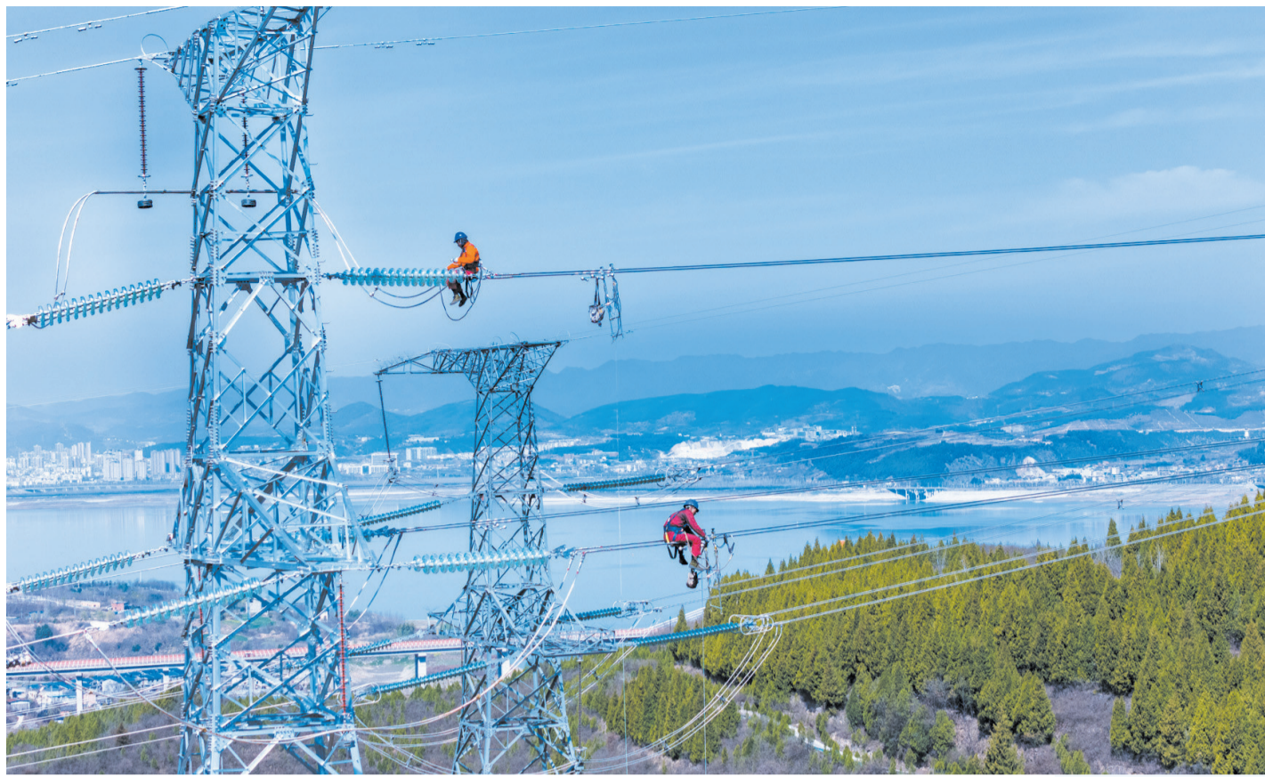
电力工人在220千伏高压线塔上安装绝缘瓷瓶。