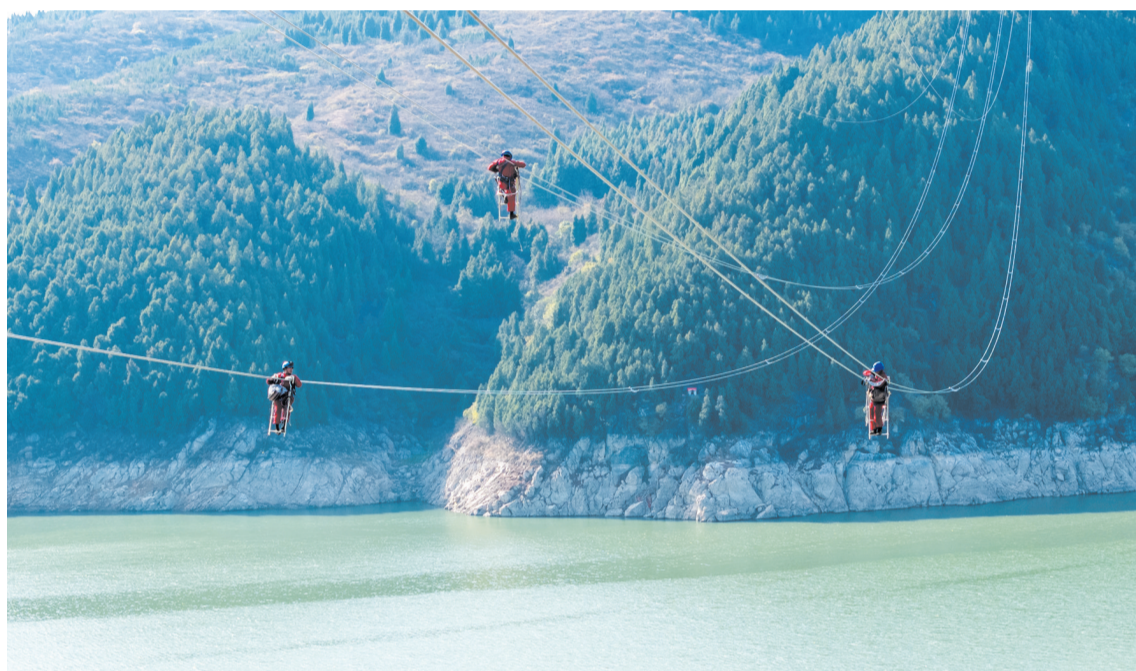
电力工人在汉江郧阳区段悬空安装高压线间隔棒。