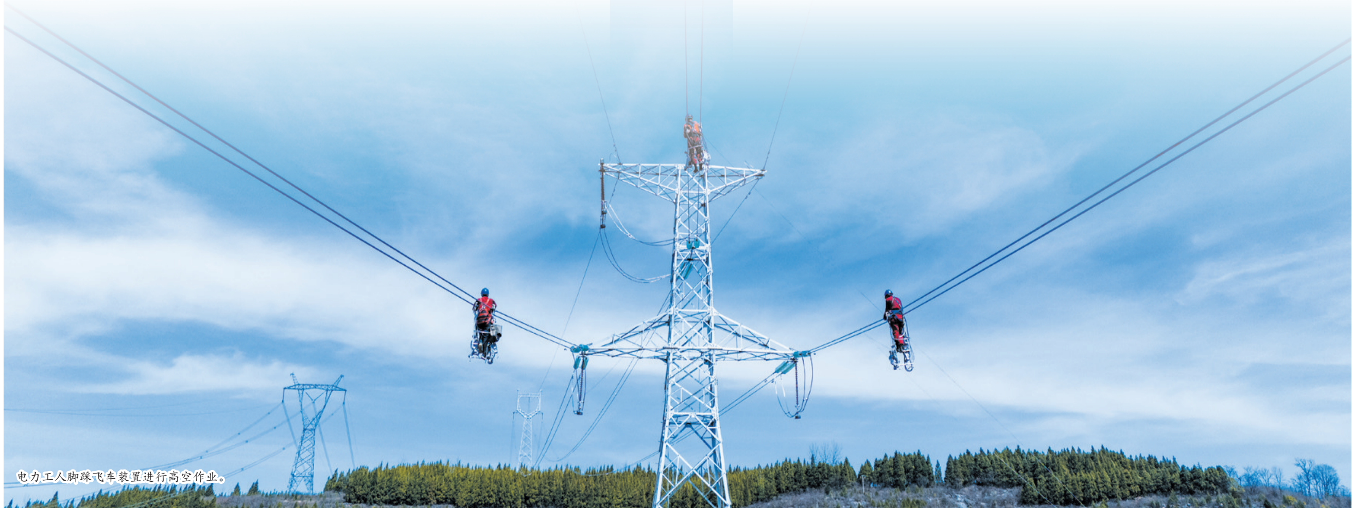
电力工人脚踩飞车装置进行高空作业。

俯瞰十堰大地,从日新月异的都市到生机勃勃的乡村,从如火如荼的项目建设现场到烟火升腾的街头巷尾,一座座铁塔巍峨耸立,一条条银线飞跃高悬,一座座现代化变电站遍布山河。强劲的电正擎起璀璨灯火,为十堰经济社会发展输送着澎湃不息的动能。