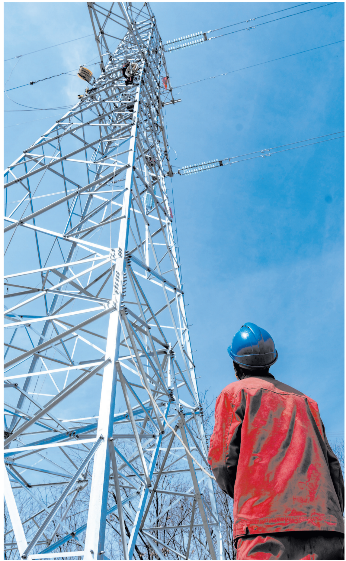
塔下的电力工人时刻注视着在塔顶施工的工友。