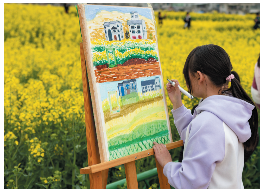
花海写生，趣味盎然。