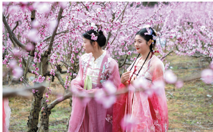
人在画中走，画随人流动。