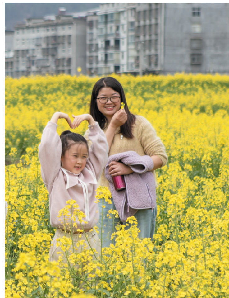
风过十里菜花黄，人在画中步履香。