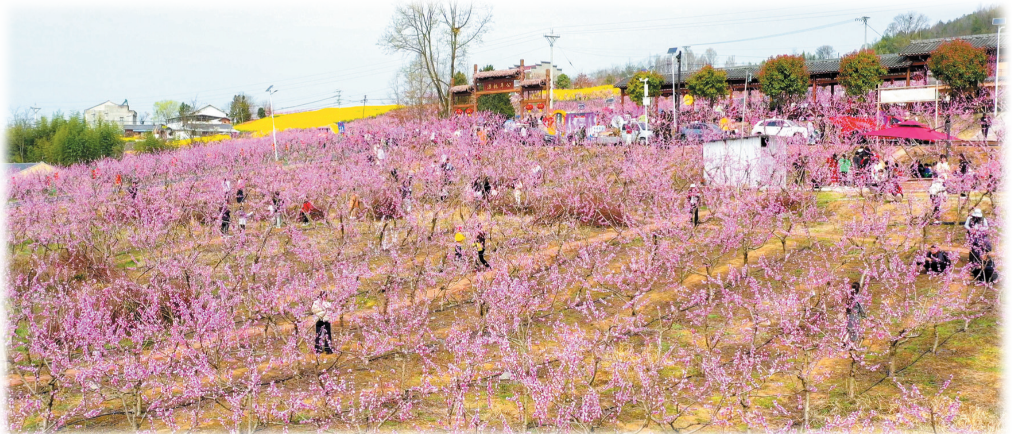
桃园几许，收尽春光。