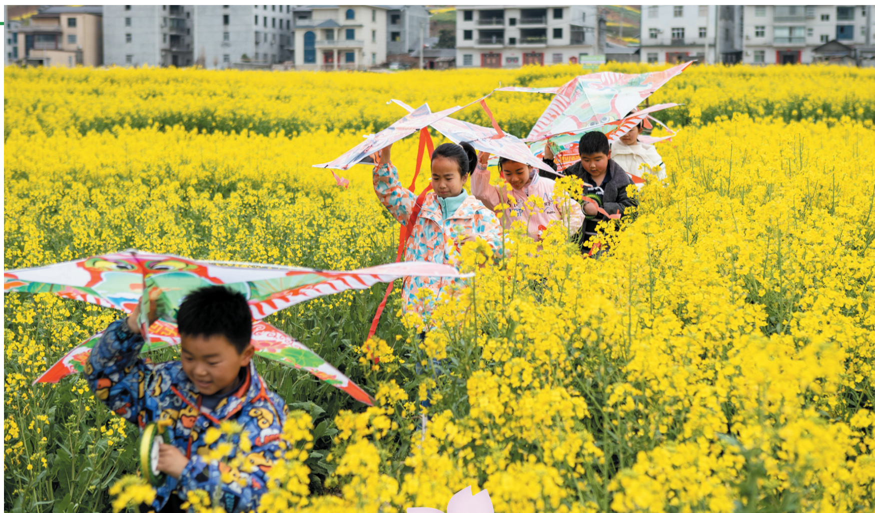
儿童急走追黄蝶，飞入菜花无处寻。