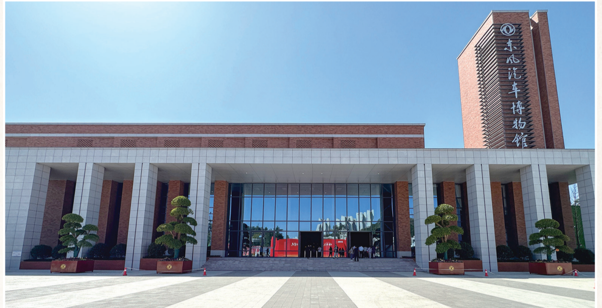
集专题展览、馆藏研究、科技普及、互动体验、发布中心等功能于一体的东风汽车博物馆。