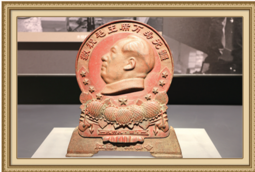
1969年,“二汽”第一炉铁水浇注的毛主席像章。

半个多世纪的奋斗奋进,一代代东风人书写了以产业报国、匠心造车服务用户的精彩篇章,成为中国汽车工业发展史上最浓墨重彩的一笔。