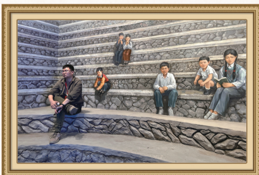
利用光影技术打造的“露天电影”展区。