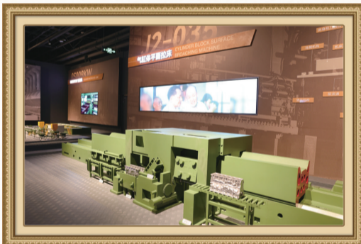
有“千手观音”之称的缸体大拉床。