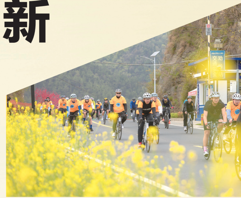
环赛武当国家级自然保护区生态骑行。