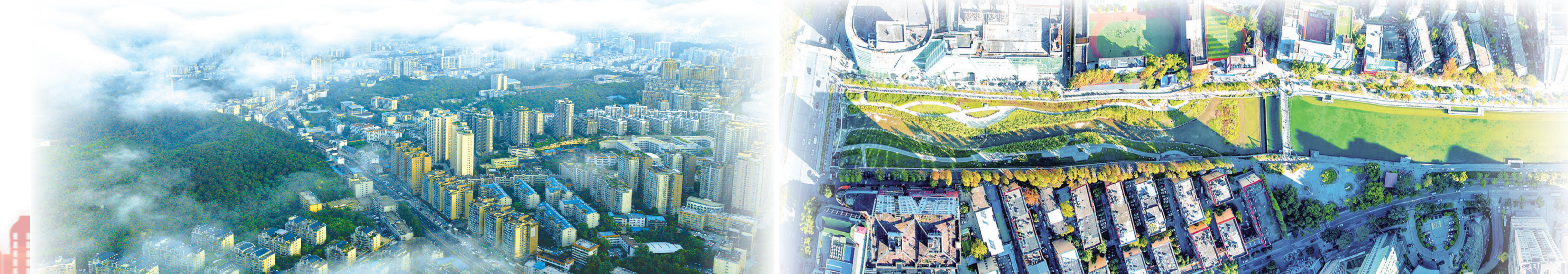
俯瞰经济社会高速发展的茅箭区。