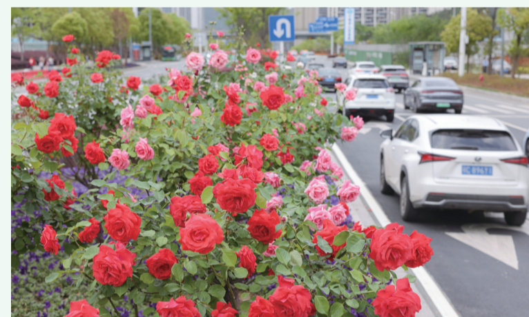
绿刺含烟郁,红苞逐月开。摄于张湾区紫霄大道。