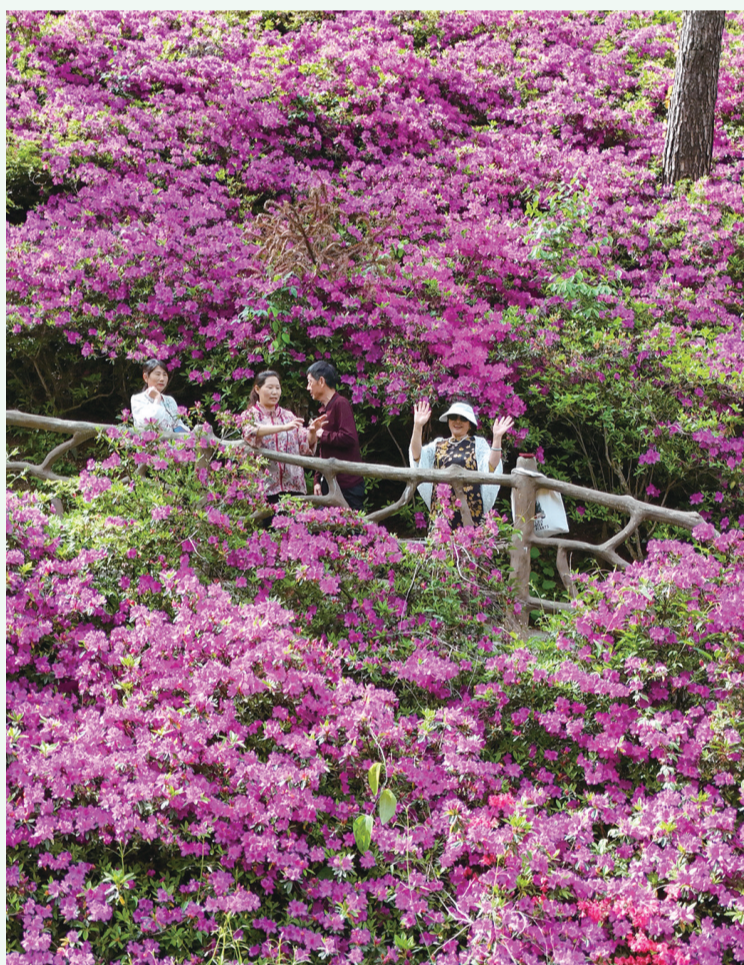
最惜杜鹃花烂漫,春风吹尽不同攀。摄于茅箭区茅塔乡东沟村。

四月的十堰,繁花似锦,春意正浓,处处可见无与伦比的春日盛景,等待着每一个热爱生活的人前来邂逅,在花海中感受春天。