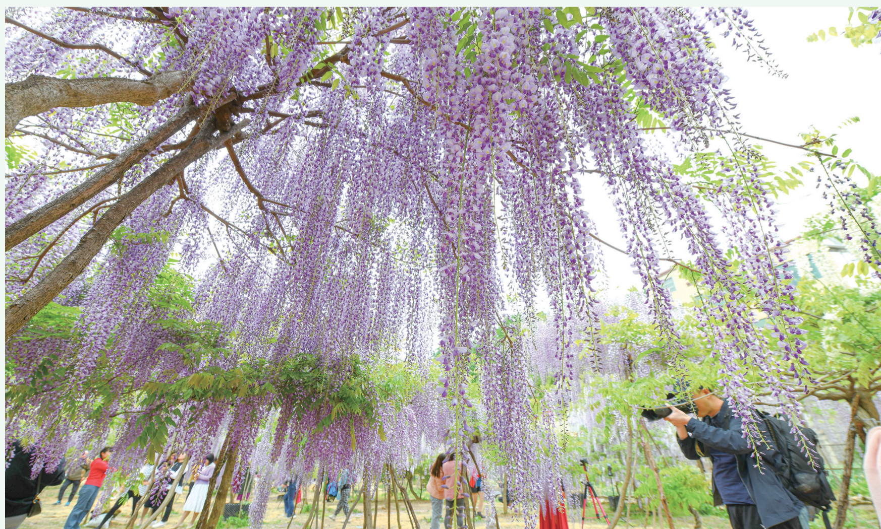
紫藤挂云木,花蔓宜阳春。摄于张湾区西沟乡。