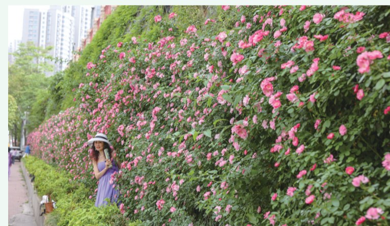
蔷薇开暖春风,万朵千枝簇锦丛。摄于张湾区汉江路街道。