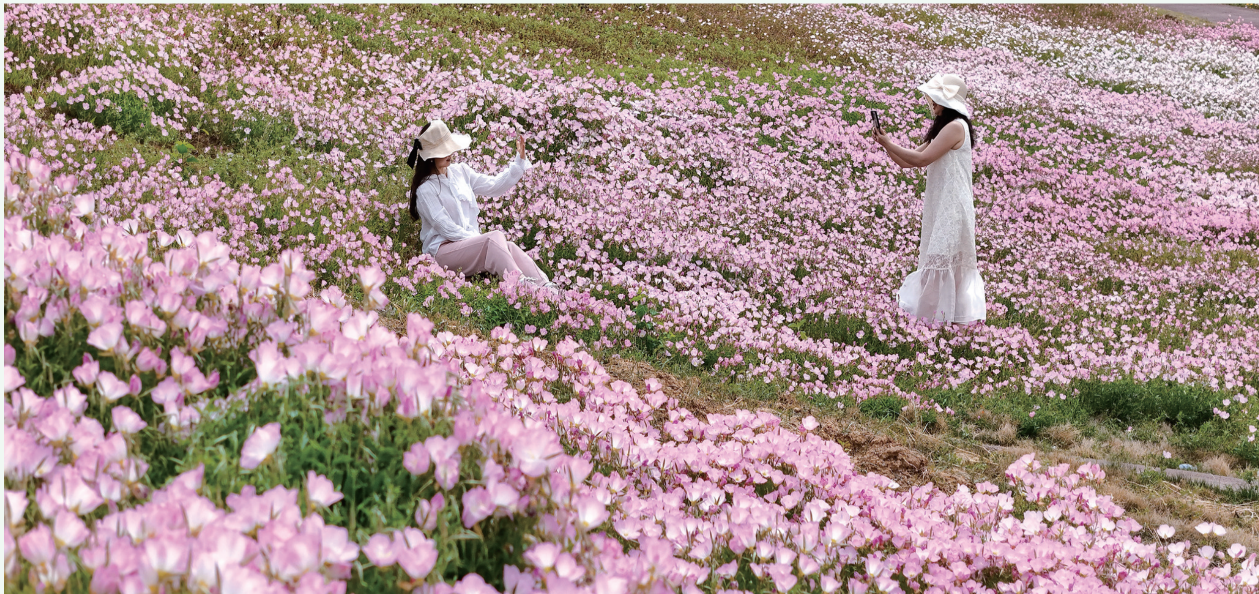
徜徉花海心自闲,春风拂面醉红颜。摄于郧阳区同心广场。