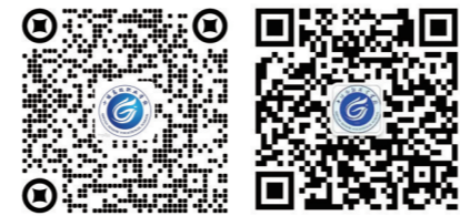
学校全景地图 二维码

面进入高质量发展阶段,连年获多项市级以上荣誉,包括“市直机关党建工作先进单位”“十堰市精神文明先进单位”“清廉学校示范点”“全市共青团工作先进单位”等称号。