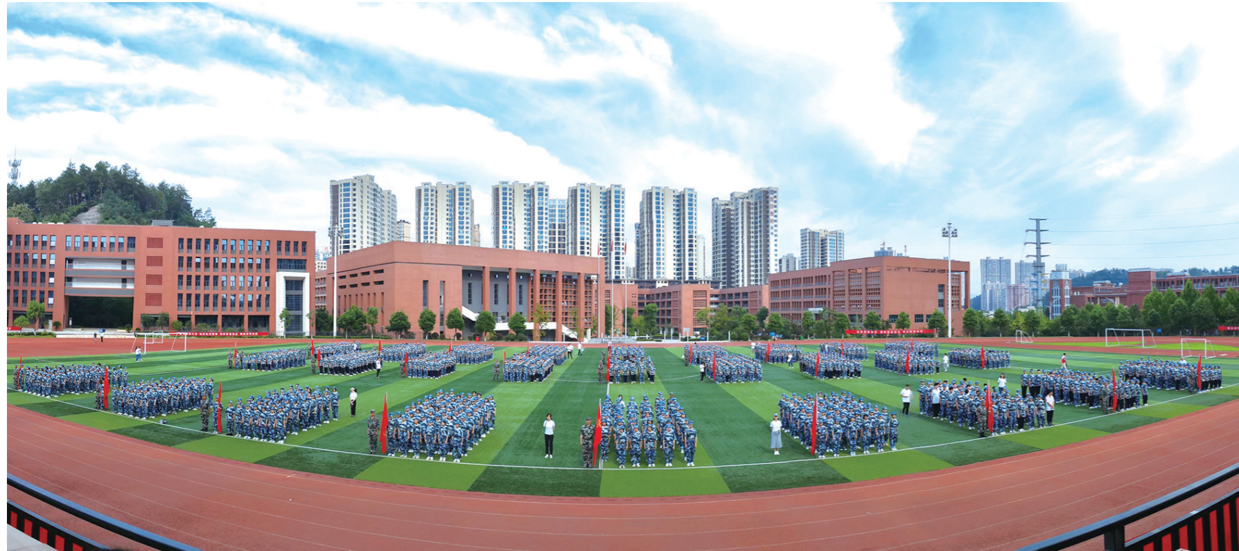
新生军训结营汇演。

十堰高级职业学校创办于1979年,是十堰市政府主办的全日制中等职业学校。作为全国首批重点中等职业学校、全国教育系统先进集体及全国职业院校数字化校园建设实验校,学校秉承“质量立校、特色兴校、文化引领、内涵发展”的办学理念,构建以“润心启智、润德开物、品味美好、品质生活”为核心的“润·品”校园文化体系,致力于培养兼具专业技能与职业素养的高素质技术技能人才。2024年,学校以优异成绩通过湖北省“双优校”中期验收。