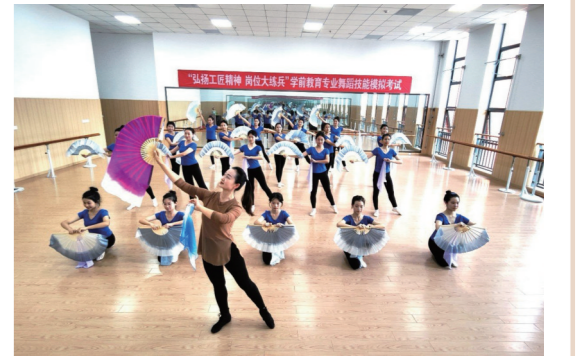
学前教育部实训课。