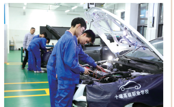
汽车机电部实训课。