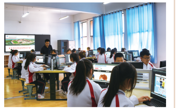
财经商贸部实训课。