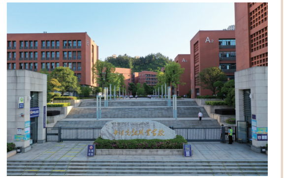
十堰高级职业学校正大门。