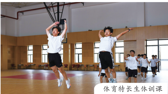
体育特长生体训课