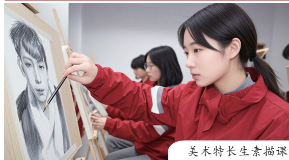
美术特长生素描课