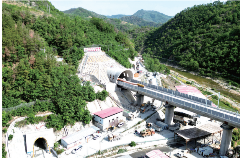
位于郧西县土门镇的西十高铁园岭隧道出口。