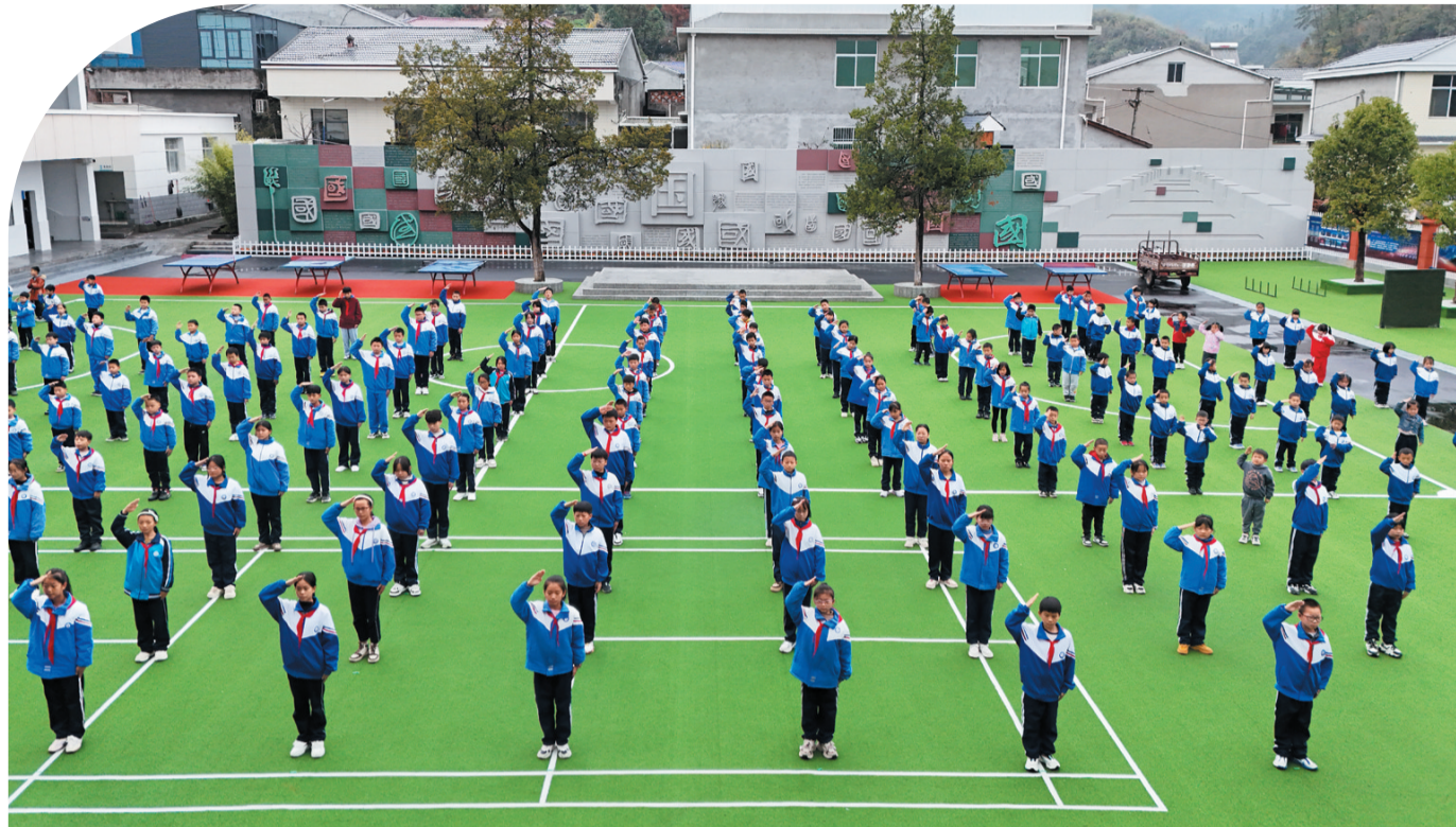
佛台小学《少年起步歌》特色课间操。

这样的场景,不仅在佛台小学上演,竹溪县职业技术学校、竹溪县实验小学、竹溪县思源实验学校、蒋家堰镇中心小学等思政教育试点学校也同样精彩纷呈,校园里涌动着一股别样的热潮。当“迷彩绿”遇上“思政红”,一场以军魂铸就德育的生动实践,正在鄂西北的青山绿水间绽放出独特光彩。