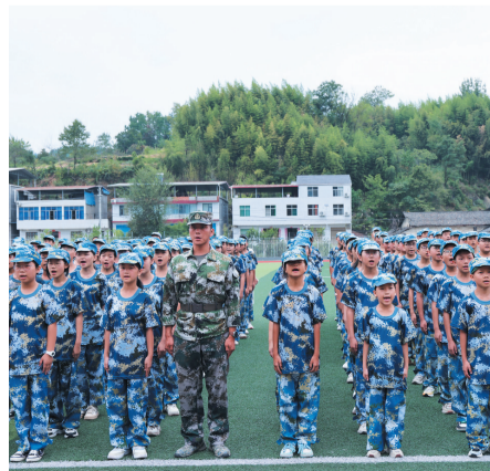
竹溪县思源实验学校开展素质拓展活动。