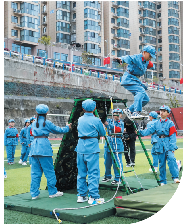
竹溪县实验小学迷彩思政课。