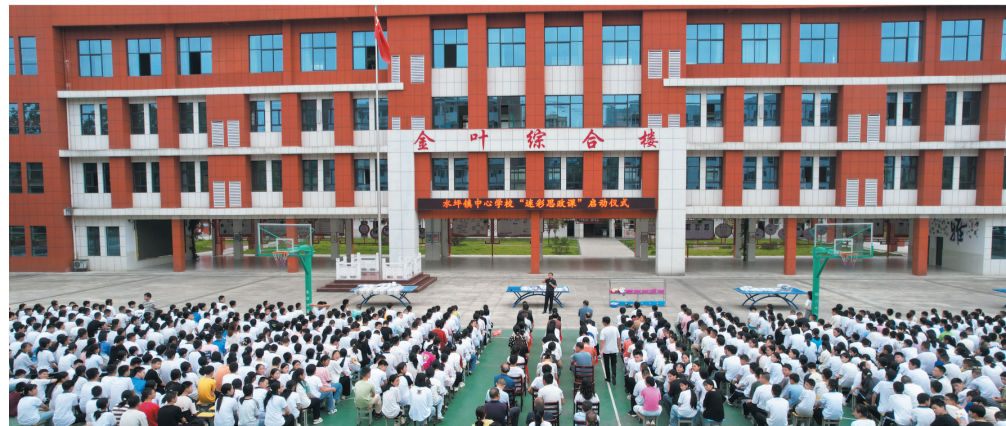
水坪镇中心学校“迷彩思政课”启动仪式。