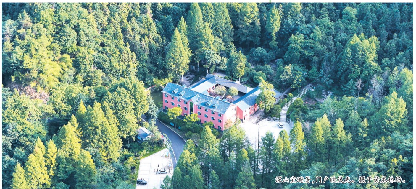
深山宜避暑,门户映岚光。摄于黄龙峡林场。