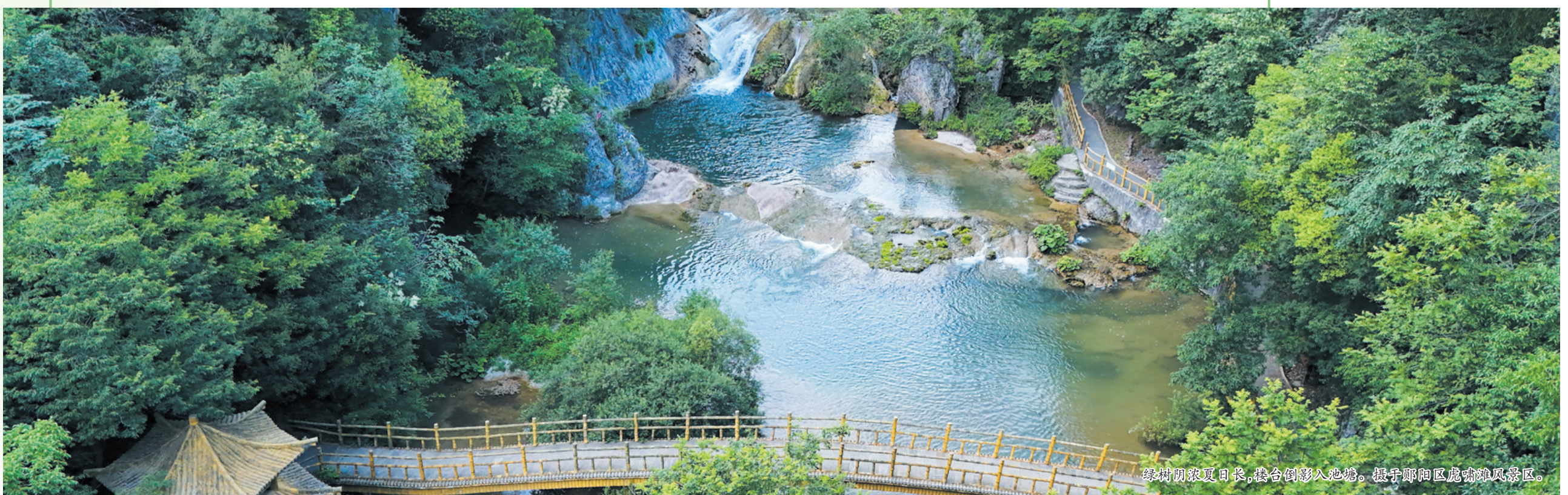
绿树阴浓夏日长,楼台倒影入池塘。摄于郧阳区虎啸滩风景区。