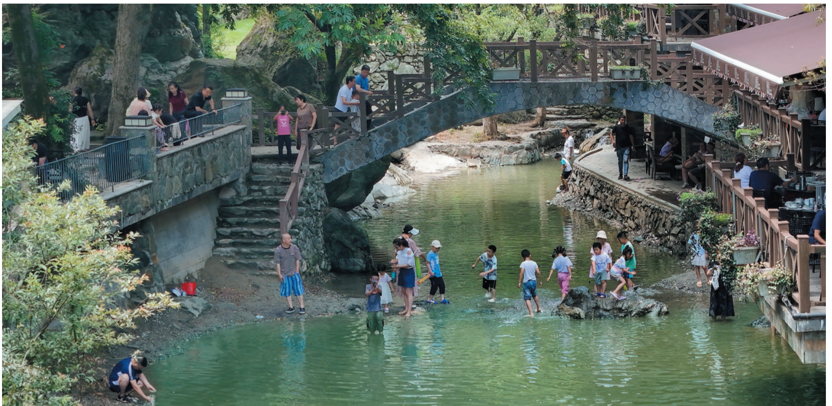
烈日炎炎照溪水,戏水儿童逐浪飞。摄于茅箭区大川镇。