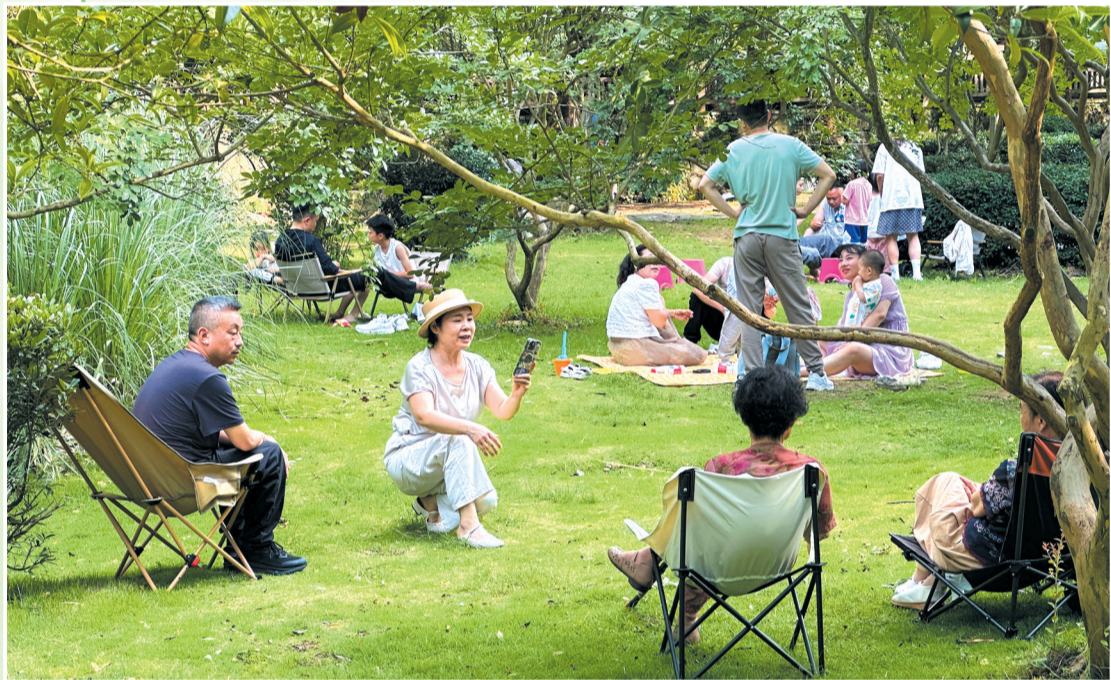
竹深树密虫鸣处,时有微凉不是风。摄于牛头山国家森林公园。

盛夏时节,日光如熔金倾泻。当热浪裹挟着蝉鸣在楼宇间翻涌,十堰的山水秘境正舒展着清凉的臂弯,邀人遁入其中,赴一场清凉之约。牛头山国家森林公园、茅箭区大川镇、张湾区花果街道桃子村的百龙潭景区、郧阳区大柳乡白泉村的虎啸滩风景区……这些镶嵌在城市边缘的“绿宝石”,用茂密森林与澄澈溪流,编织出专属于十堰人的夏日清凉梦。