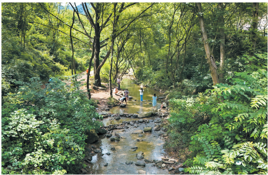
云影荡山翠,泉声乱溪湍。摄于张湾区百龙潭景区。