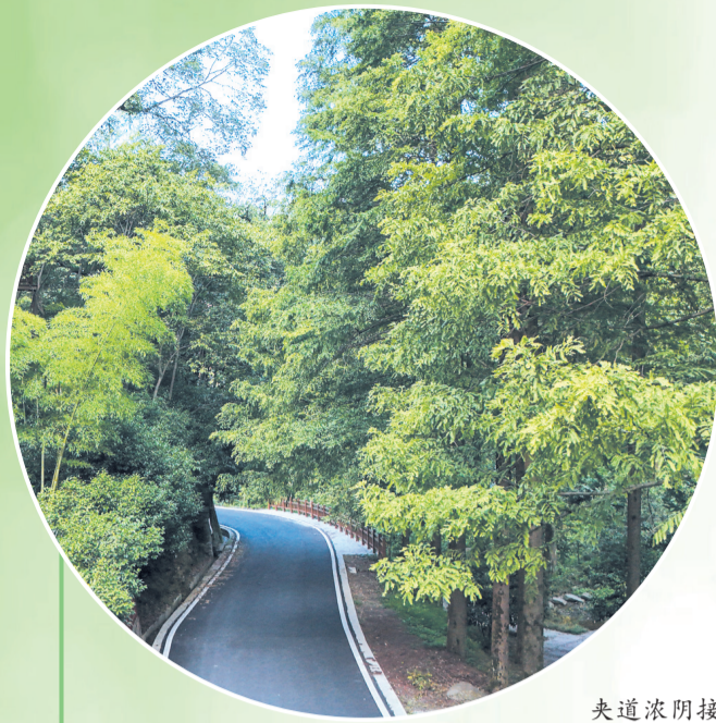
夹道浓阴接翠微,蝉鸣高下送清晖。摄于张湾区柏林镇秦家坪村。