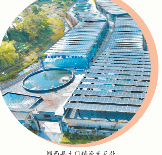
郧西县土门镇渔光互补设施渔业基地。