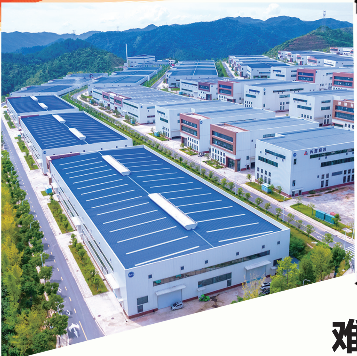
郧西县河夹绿色低碳数字化新型园区。