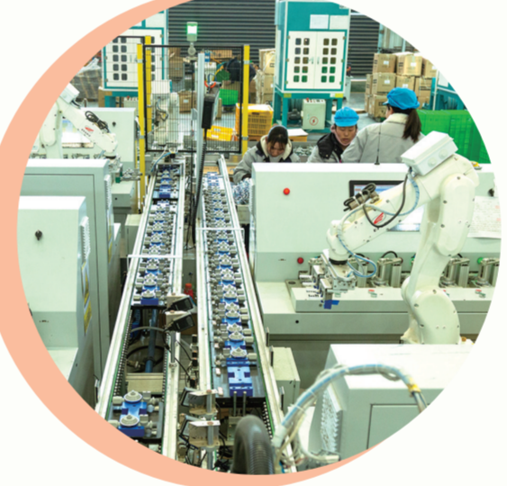
郧西县湖北奥维工业有限公司自动化生产检测线。

“我们每周至少安排1名党政领导跑项目,还固定1名县领导带队工作专班驻守武汉、北京对接。”郧西县发改局相关负责人说,这种“跑省进京”的韧劲已结出丰硕成果:去年争取到中央预算内项目数量居全省第一,到位资金居全省第二;今年上半年到位资金10.3亿元,同比增长18%,继续保持全省领先地位。 在众多项目中,郧西新能源项目格外亮眼——它是全省12个纳入“双风行动”项目中唯一落户县的项目。该项目从申报到开工仅用3个月,创造了新能源项目落地的“郧西速度”。 “我们在京津冀、大湾区、长三角等重点区域开展常态化招商,派出24名干部常驻一线对接。”郧西县招商服务中心相关负责人介绍,今年已有5名县领导带队出征,深入推进“大员招商”工作。 功夫不负有心人,一批优质项目相继落户郧西:为浙江杭州“六小龙”提供算力支持的八维通公司将中芯智算和航空经济项目落户郧西;福特丽科技芯片封装项目即将投产,大健康产业园项目也成功落地。 据统计,上半年该县签约项目74个,再创历史新高。新入库项目134个,占今年市定目标的59%,实现了投资量、工作量、实物量“三量”齐增。 “招商”出彩,“在建”出彩。10条高速公路郧西南出口、两两一级路等项目加快推进,七夕浪漫绿色长廊入选全国交通与旅游融合创新示范项目,西十高铁郧西段已全面进入铺轨阶段。高铁开通后,郧西到西安只需1小时,到武汉缩短至2小时,将融入鄂豫“1小时经济圈”,更令人期待的是,陕西省安康市白河县将收购郧西高铁小镇2栋房产,并设立办事处,推动两地游客互送、产业协作。