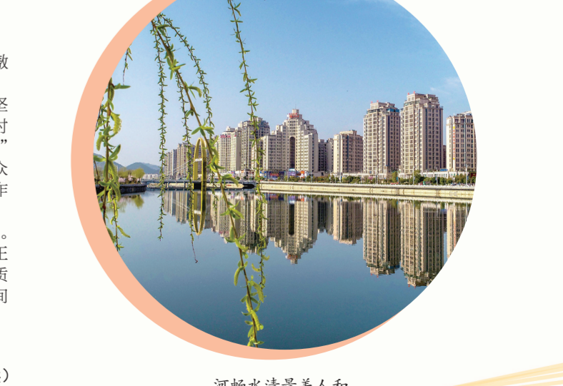
河畅水清景美人和。