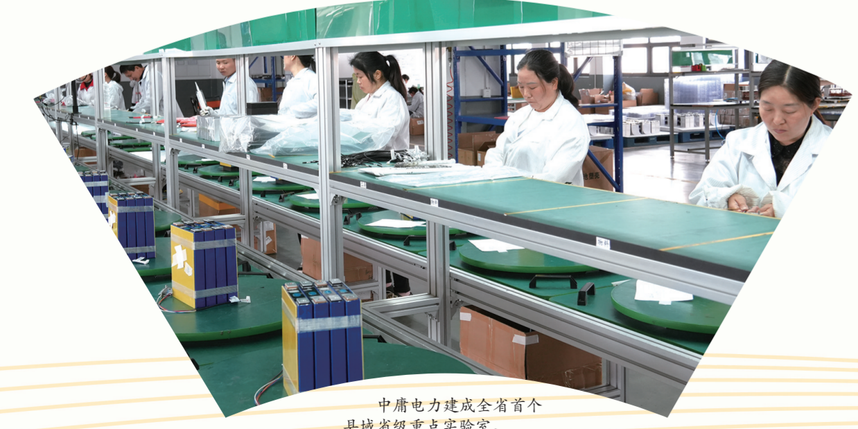
中鼎电力建成全省首个县域省级重点实验室。