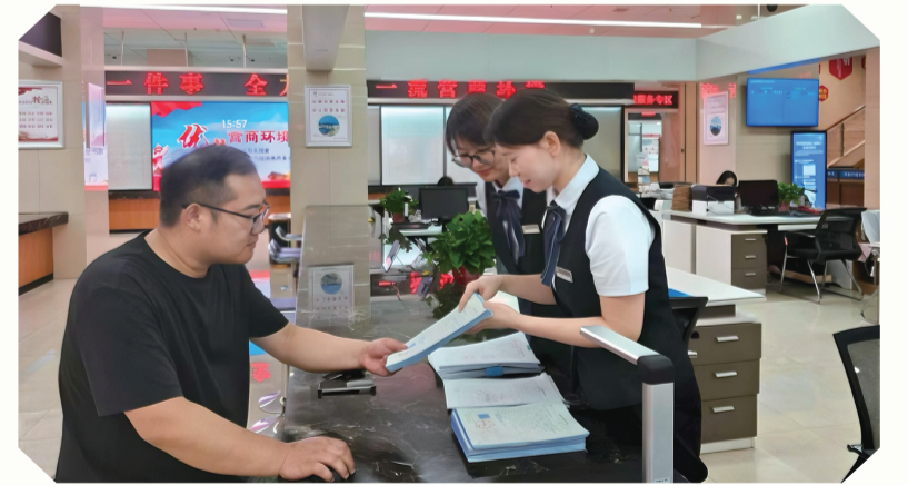
耐心细致为群众办理业务。

以强烈责任担当做优服务,以坚实数据支撑助力转型。当下,郧西县数据局积极培育数据开发利用新模式,推动算力、数据、应用、产业协同联动,充分发挥数据要素乘数效应,为实现数字经济发展壮大、全域经济转型升级,助推全县经济社会高质量发展贡献力量。