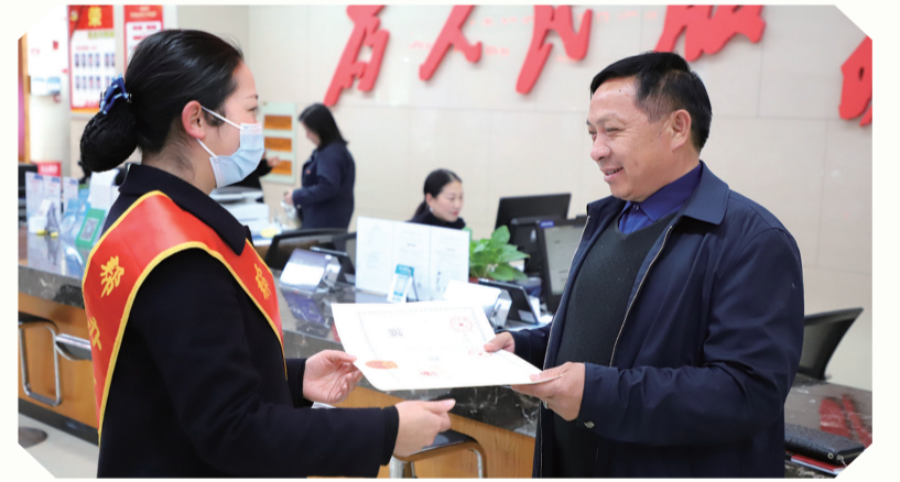
帮办代办服务获群众好评。

通过创新“预指导+云勘验”模式,依托十堰市工程建设项目审批平台,在项目审批四阶段实施“并联审批、限时办结”,今年以来,该局共为510家企业提供全流程“预指导”服务,实现并联审批率达74.81%。