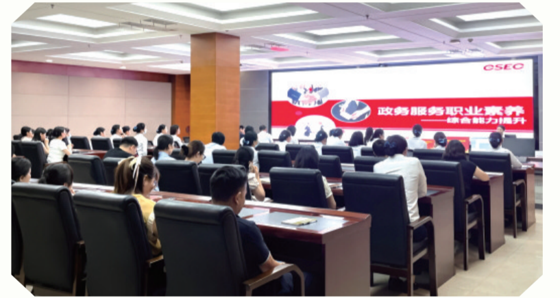
开展政务服务职业素养专题培训。

平台32项高频业务下沉基层受理服务,全力构建“一件事”集成服务体系,落实省定61项“告知承诺+容缺受理”、59项“告知承诺+容缺办理”事项,建立“承诺即受理、容缺先审批”机制,实现审批时限平均压缩40%以上。与8地签订跨省通办协议,实现140项跨省通办事项和1000项全省通办事项落地。联合郧阳区、陕西旬阳等地打造“鄂陕边际”政务品牌。聚焦乡村振兴、营商环境、民生实事等领域,发布政务信息5200余条,依申请公开受理15件,办结率达90%以上。