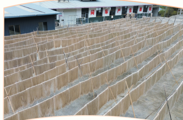
无矾红薯粉条生产晾晒。

江风如诗,碧波如歌。如今的汉江羊尾段,沙鸥翔集,鱼群嬉戏,廊桥与青山倒映水中,构成一幅流动的生态画卷。而在这幅画卷里,“老船工”志愿服务队的“红马甲”始终是最鲜亮、最温暖的色彩——他们用四年的坚守证明,当“守护”内化成为一种习惯,当“文明”植根于日常,守护“一泓清水永续北上”的承诺,便能在无数人的接力中愈发坚定;人与自然和谐共生的画卷,必将在汉江两岸的守护中愈发壮美。