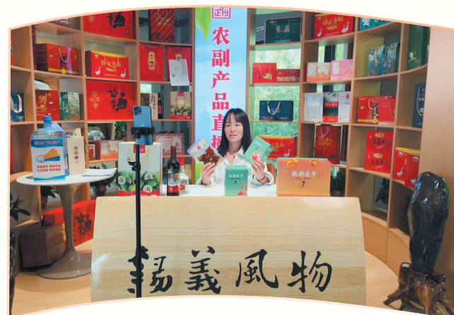
羊尾镇农副产品直播展销。