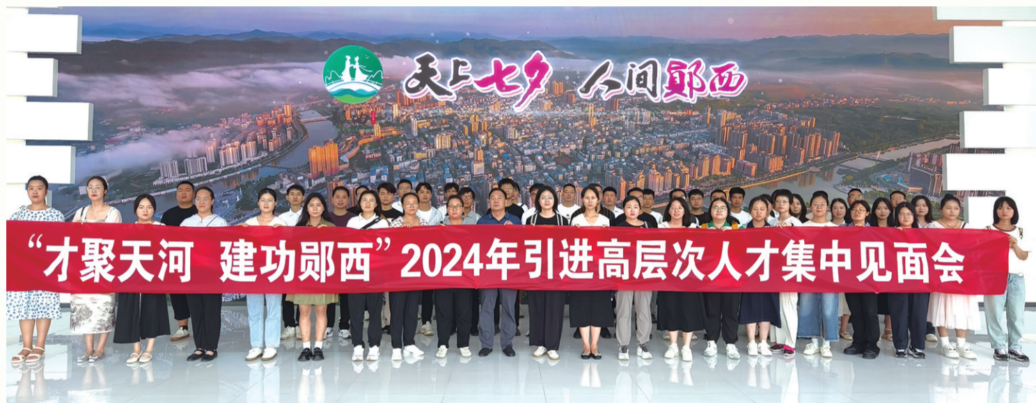
“才聚天河 建功郧西”高层次人才集中见面会。

“我们持续深化人才强县战略,抢抓南水北调对口协作、东西部协作、西十高铁即将开通等发展机遇,锚定建设鄂陕毗邻区域人才高地目标,力争到2030年人才资源总量达到10万人,引进高层次人才400人以上,建成省级重点实验室、产业技术研究院5个以上,打造省级典型案例5个以上,初步实现数量充足、素质优良、结构优化、布局合理、活力迸发的人才发展目标。”8月15日,郧西县委人才办相关负责人接受记者采访时说。