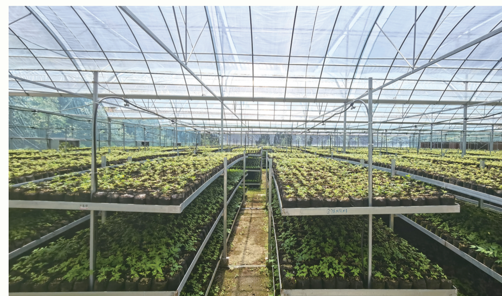
六官坪林场发展温控大棚育苗。

为大力发展木本油料产业,该县林业局制定《2025年木本油料产业链工作要点》,编制《2025年度县级木本油料产业发展乡村振兴项目库》,争取国家、省级林下经济、油茶发展、林