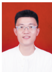
汽车部 22133 班主任: 黄长江

张晶晶坚持“以生为本,德育为先”的理念,将班级管理工作做细做实。注重培养良好班风学风,营造积极向上的班级氛围,关注学生心理健康,加强家校共育,助力学生全面发展。把握成长契机,踊跃参与校内及市级班主任能力大赛。备赛期间,以班级管理中的真实案例为切入点,通过家校协同、心理疏导等方式解决学生成长问题,凭借扎实的理论功底和出色表现,获得校内一等奖和市级一等奖。