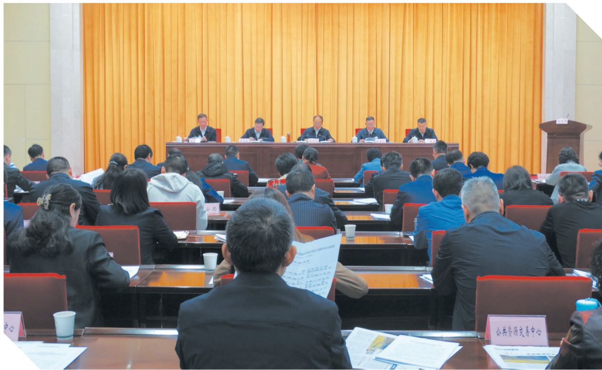
召开2025年市直机关党的建设暨2024年机关党组织书记抓基层党建工作述职评议会议。