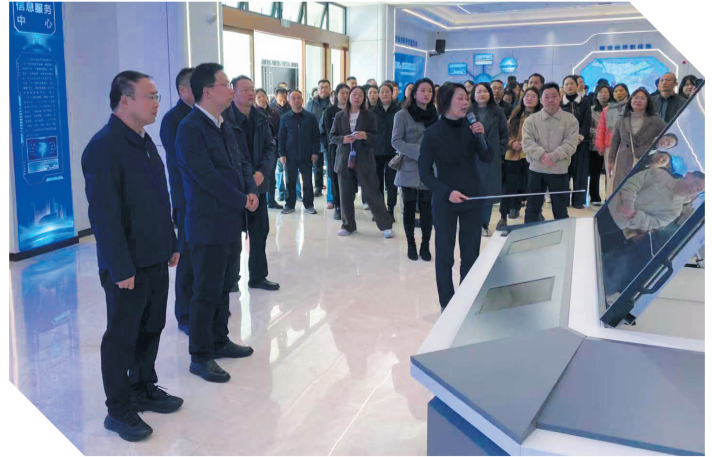
组织市直单位机关党委专职副书记参观竹山通用机场。

地,以整改实效推动机关党建工作提质增效。2025年,市委直属机关工委通过一系列扎实的举措,推动机关党建工作取得显著成效:理论武装更加深入,基层基础更加牢固,党建融合更加紧密,纪律作风更加严明,为打造鄂西区域性中心城市提供了坚强组织保障。2026年,市委直属机关工委将继续以深化模范机关建设为牵引,以促进党建业务深度融合为重点,以纵深推进“清廉机关”建设为载体,全面提高机关党建质量,为奋力谱写中国式现代化湖北实践十堰篇章贡献机关党建力量。