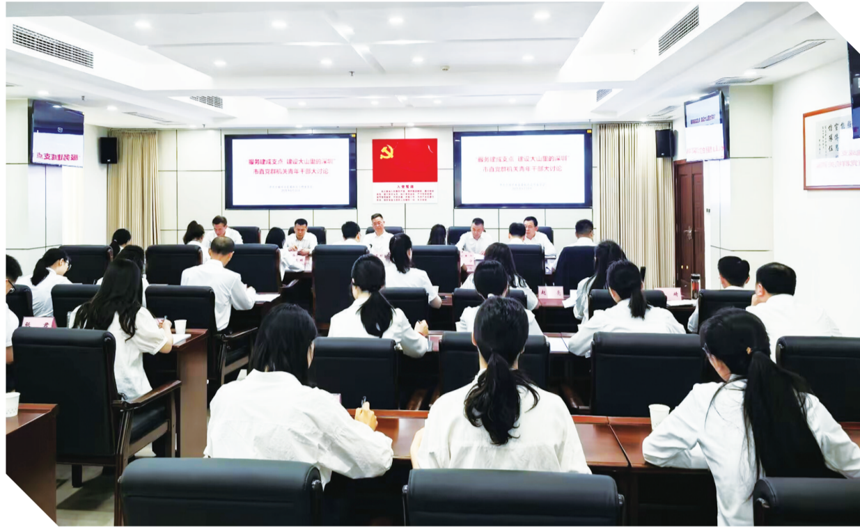
组织党群机关年轻干部交流研讨。

九万里风鹏正举。2025年,十堰市直各机关以党建引领发展、把党建融入发展,以昂扬进取之姿“创一流、争第一、干唯一”,成为服务支点建设的“火车头”和打造鄂西区域性中心城市的主力军。