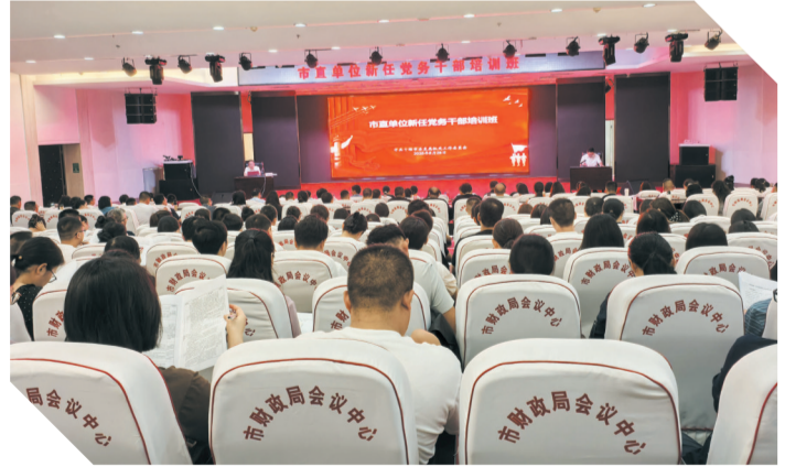
举办市直单位新任党务干部培训班。

国际文旅推介活动,助力十堰文旅产业“出圈”。切实助力中心工作,推动提质增效。工委制定茅箭区驻村工作要点,领办营子村通组道路拓宽硬化、老茶园提档升级等2项民生实事,助力乡村振兴。开展党委部门、政法系统创先争优工作交流展示和“服务建成支点建设大山里的深圳”市直党群机关青年干部大讨论活动,引导机关干部立足岗位建功立业,服务十堰高质量发展。选派68名市直机关党建专员下沉社区,领办“老旧小区改造”“养老服务提升”等民生实事120余项,解决群众急难愁盼问题,打通服务群众“最后一公里”。