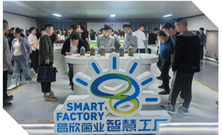
组织市直单位新发展党员在郧阳区参观昌欣食用菌产业基地。

在组织生活中,坚持“淬党性、强修养”。狠抓“三会一课”、民主生活会等制度落实,指导各支部利用“十堰红”基层党建信息平台规范记录组织生活。成立9个督导组,对市直单位2024年民主生活会进行全覆盖全过程全方位督导,推动党员干部严肃认真开展批评与自我批评,党内政治生活的政治性、时代性、原则性、战斗性显著增强。