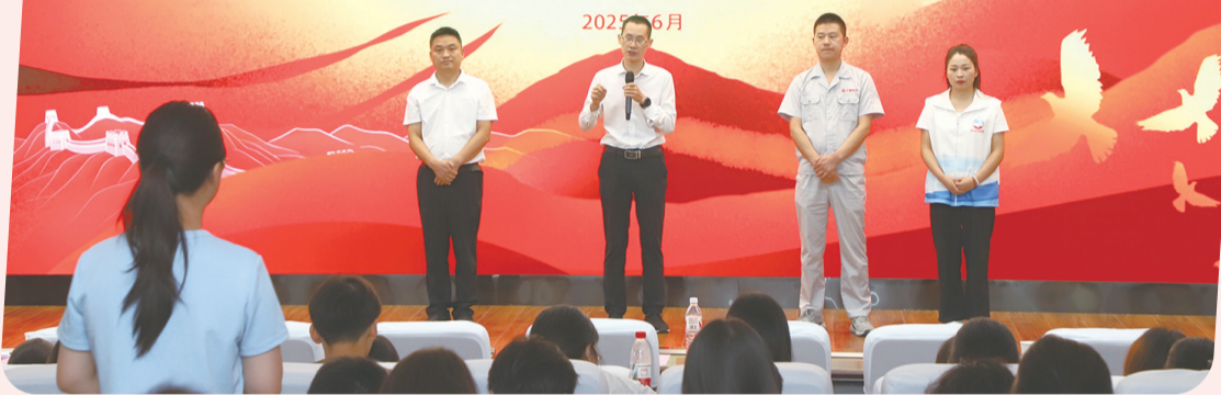
开展“青春为支点建设挺膺担当”主题大思政课宣讲。