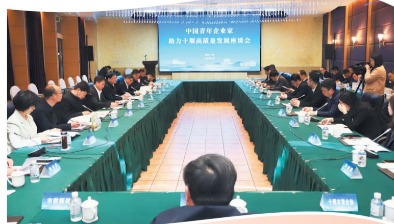
组织“中国青年企业家十堰行”系列活动。

一系列暖心务实的举措,精准破解青年在堰工作生活的急难愁盼,持续提升青年的归属感与幸福感,有效凝聚“青年留堰、人才兴堰”的强大合力。