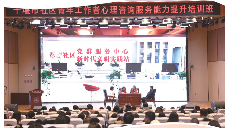
十堰市社区青年工作者心理咨询服务能力提升培训班现场。

青春正当时,不负新时代。2026年,团市委将继续秉持“功成不必在我,功成必定有我”的使命担当,锚定青年对美好生活的向往,持续深化改革、深耕服务,团结带领全市青年以青春之我、奋斗之我,为十堰加快建设鄂西区域性中心城市注入澎湃的青春动能。