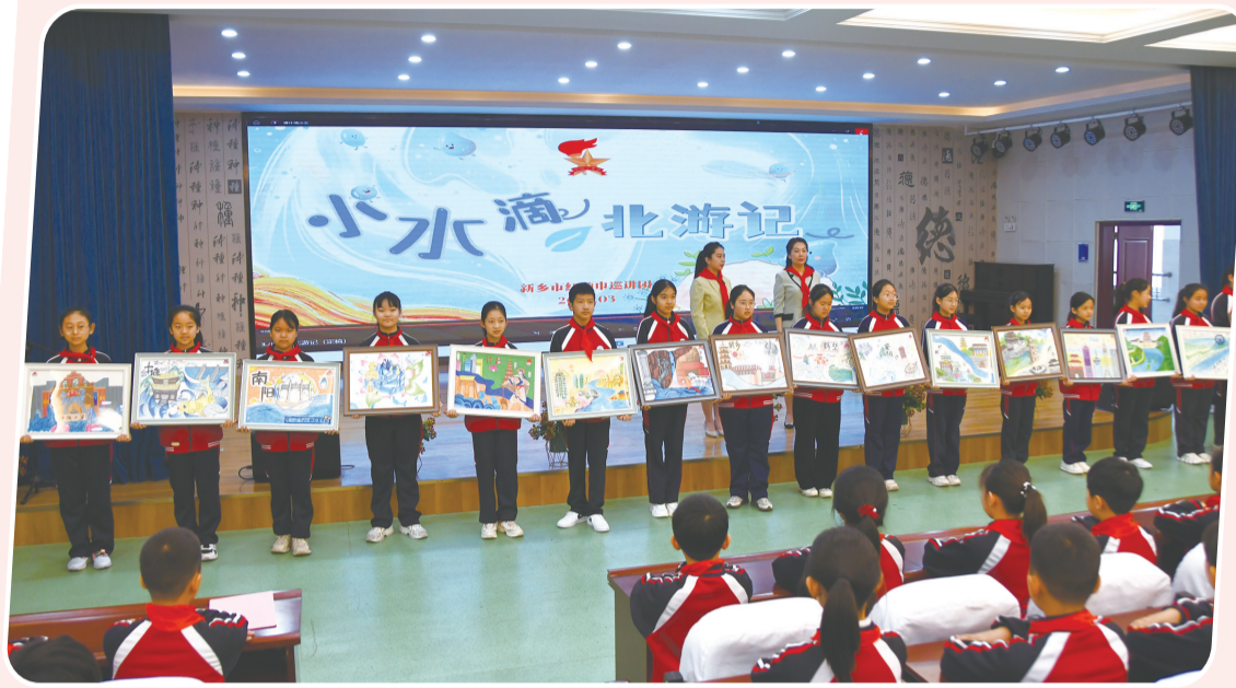
北上巡讲活动期间,河南省新乡市种德小学少先队员以南水北调中线工程沿线城市特色风貌为主题绘制画作,并现场赠予十堰市青少年。