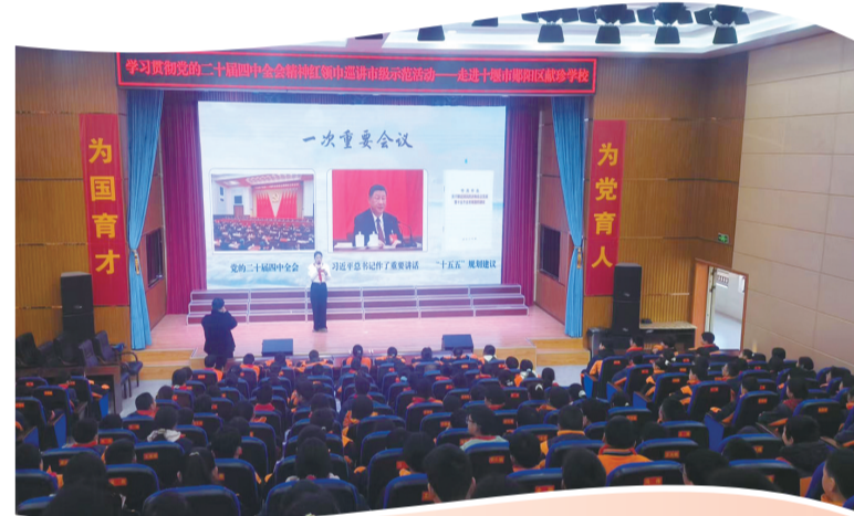
开展学习贯彻党的二十届四中全会精神红领巾巡讲市级示范活动。

同时,打造“青春十堰”全媒体矩阵,以青春视角讲好十堰故事,让十堰青年的声音传播得更远、更动听。《十堰青年,超有YOUNG!》主题视频被《中国青年报》等主流媒体转发;“十堰青年超有样”系列报道及2300余条新媒体信息,实现全网阅读量超1500万人次,“青春十堰”快手账号再度获评“2025年度影响力政务账号”。