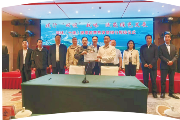
签发湖北首张鄂林（十堰）碳票。

5780亩。该项目在管理水平、建设进度、资金拨付效率等方面均跻身全国第一梯队，获国家林草局生态司通报表扬。加快“多彩森林”建设进度，完成林相季相改造15万亩，让山林景观更具层次与美感。全民植绿护绿氛围持续浓厚，全年168.4万人次参与义务植树，栽植苗木842.5万株。我市生态实践多次获得全国关注：2025年“3·12”植树节期间，央视新闻频道专题报道我市增绿护绿、守护碧水的生动实践；8月29日，十堰作为全省唯一城市，入选央视一套大型系列片《绿水青山 中国答卷》20个示范案例城市，该片第十二集《守护碧水 绿韵十堰》，详细讲述了十堰从昔日“火焰山”到“国家示范区”的转型奇迹；10月9日，国家林草局印发《林业改革发展典型案例》（第六批），十堰市“山水共治”案例被纳入并向全国推广，生态名片持续擦亮。