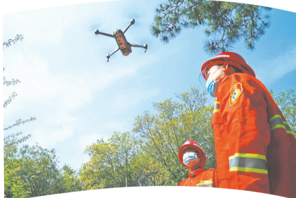
无人机巡林，筑牢森林防火安全屏障。