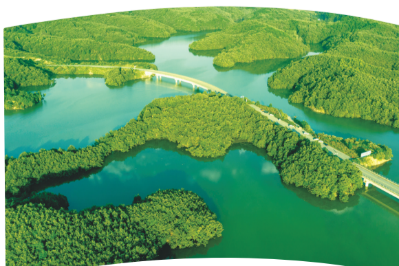
丹江口市“中国最美山水公路”两侧，繁茂的林木涵养一库碧水。