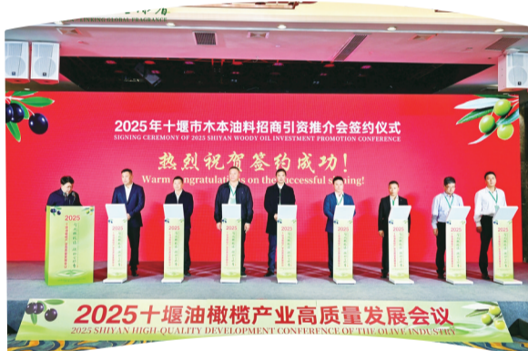
十堰市木本油料招商引资推介会在郟阳区召开。