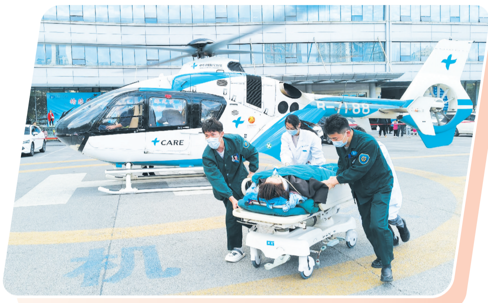
直升机13分钟转运危重患者。