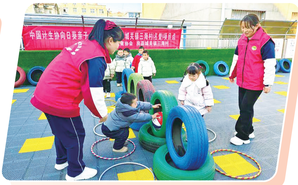
托育服务营造色彩缤纷的快乐童年。

立足鄂豫陕渝毗邻地区区位优势，以“创一流、争第一、干唯一”的担当，全力打造医疗“高原”“高峰”、夯实基层“底座”，区域医疗中心集聚辐射能力显著增强。