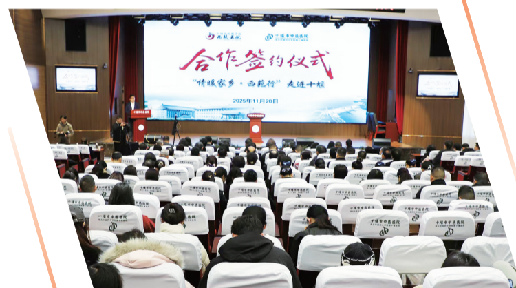
市中医医院与中国中医科学院西苑医院签订合作协议。