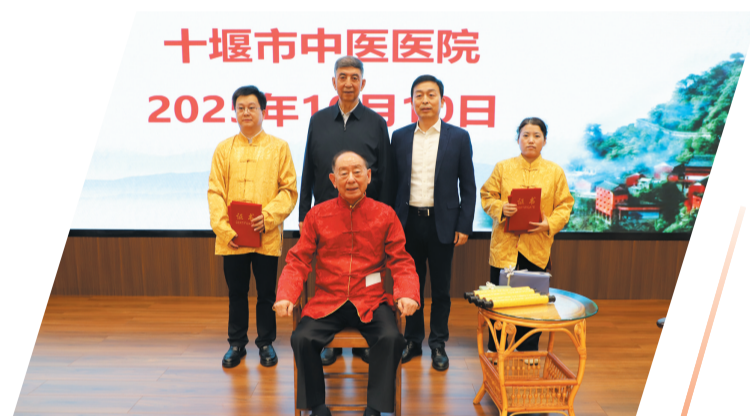
国医大师唐祖宣在市中医医院收徒讲学,成立传承工作室。

从引智赋能到专科提质,从平台搭建到技术攻坚,学科建设的水平直接转化为市中医医院业务发展的实绩。2025年,全院门诊诊疗人次达44.55万,同比增长32.43%。