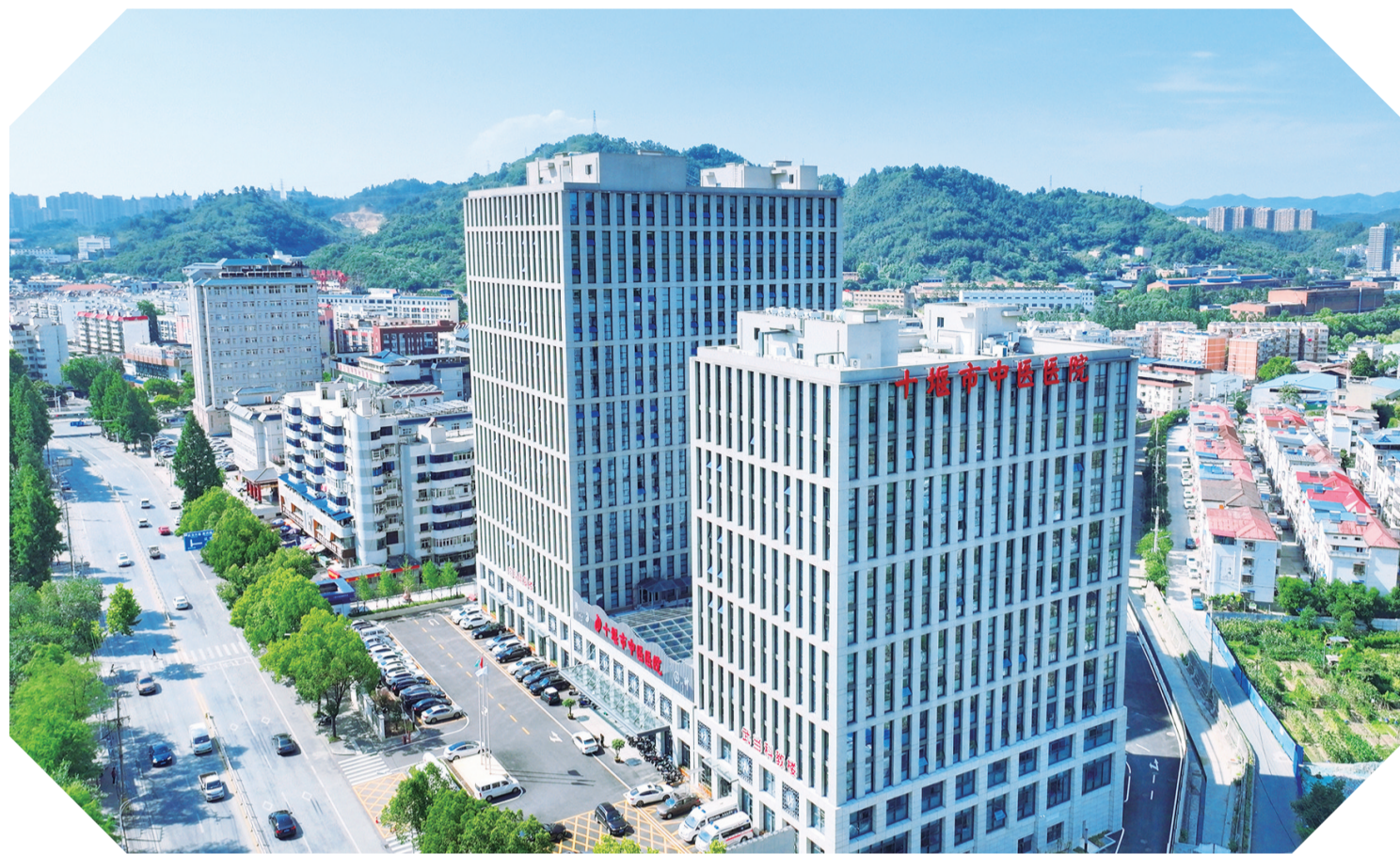
市中医医院新院区俯瞰图。

回望这一年,该院在市委、市政府及市卫健委的坚强领导下,始终以人民健康为中心,以传承创新为动力,以提升中医药服务能力为主线,在学科建设、医疗质量、特色发挥、运营管理、智慧服务等领域精耕细作,交出了一份高质量发展答卷,为区域卫生健康事业注入强劲的中医动能。