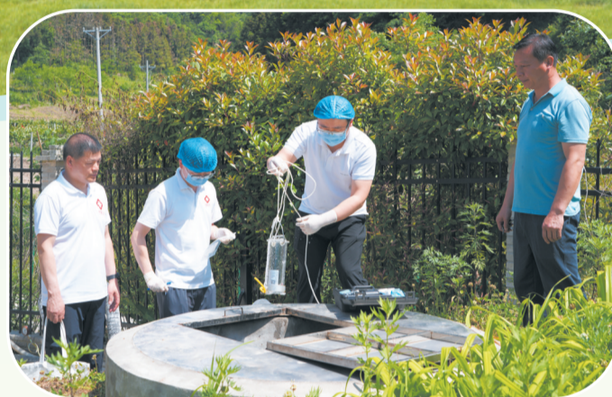
开展农村饮用水监测。