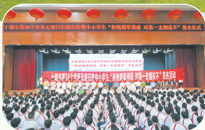
十堰市第38个世界无烟日控烟宣传暨中小学生“拒绝烟草诱惑 对第一支烟说不”签名仪式