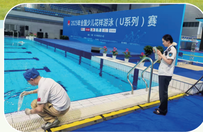
开展重大活动保障。

秦巴腹地藏担当，汉水之滨守安康。在十堰这片热土上，市疾病预防控制中心(市卫生监督所)以科学为盾筑防护底线，以专业为矛破解健康难题，默默守护着市民群众生命健康。“十四五”期间，该中心始终将“人民健康”镌刻于心、践之于行，紧扣高质量发展主线，织密监测网络，锻造技术利器，勇担守井使命，深化体制改革，书写了十堰卫生健康事业崭新篇章。