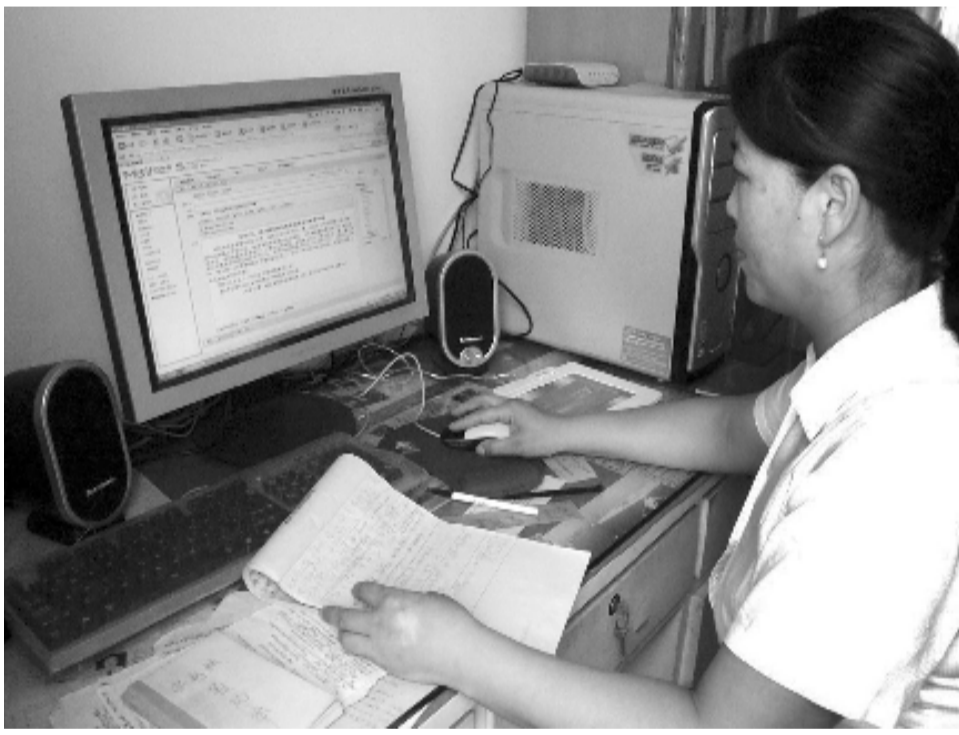
现在发稿用电脑打字,然后通过网络传输,方便、快捷。

如今,这种传统、落后的写稿方式已成为历史,随着科技进步,当今社会进入了信息化时代。现在采访写稿,通过电脑打字、网络传输,现场就可以向新闻单位发出即时报道。若是图片新闻,通过数码相机——电脑——网络的连接,几分钟就可以送到报社编辑的电脑中,方便、快捷,时效性也大大增强。稿件一旦被采用,第二天就可以见报,成了真正的新闻。