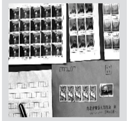
过去笔者发稿用的稿纸、信封和邮票等。