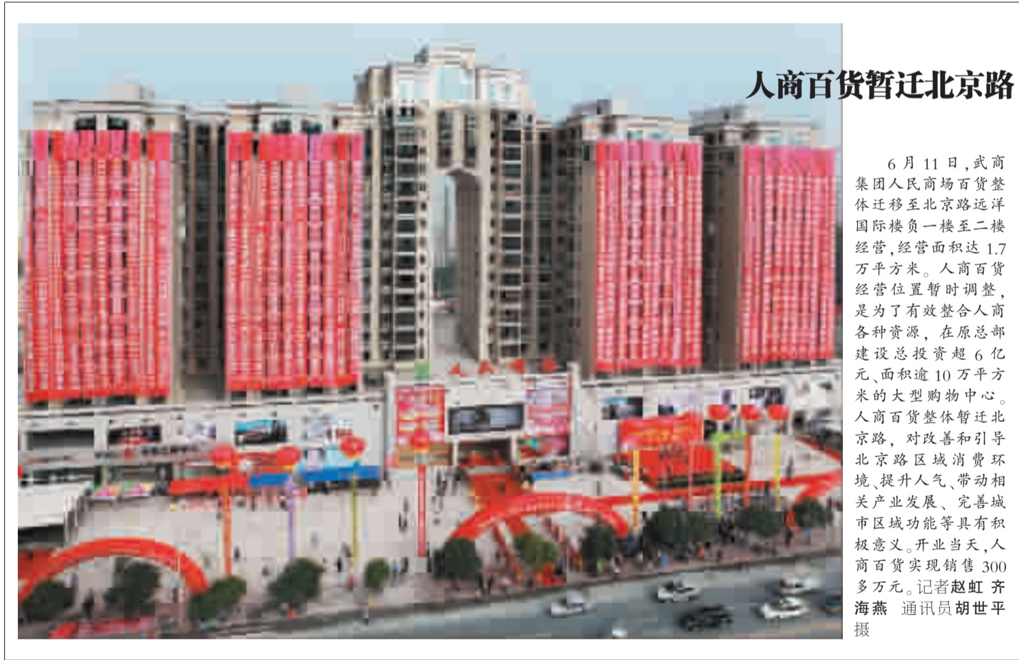
人商百货暂迁北京路

突出发展环保型工业。为确保南水北调水源地安全,武汉帮助郧西发展环保型工业。武汉市经协办积极牵头组织开展“郧西