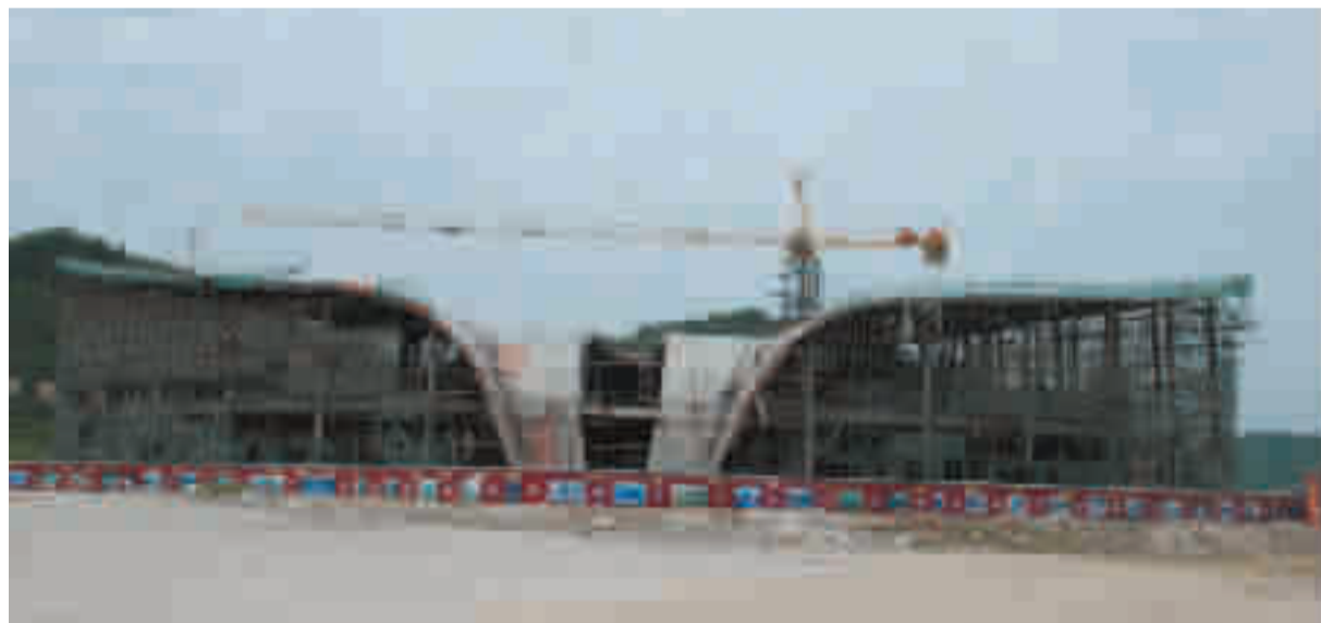
在建的武当艺术馆。

通过实施“项目兴区”战略,武当山旅游经济健康持续发展。今年1至5月份,接待旅游人数105.5万人次,实现旅游总收入3.7亿元,综合财政收入1.0735亿元,同比分别增长34%、42%、36%。