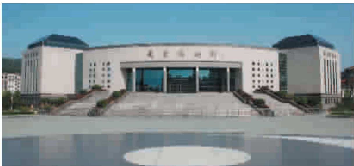
新落成的武当博物馆。