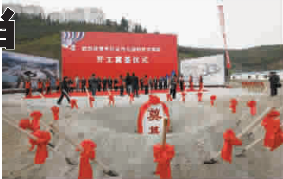
武当山国际武术院开工奠基仪式。

正在完善的10大工程:五龙宫公路改造工程路基、路面、安保工程已经竣工,隐仙岩隧道已贯通,目前完成工程总量的40%,完成投资1500万元;琼台至金顶索道改造工程上站房42根孔桩已全部浇筑成