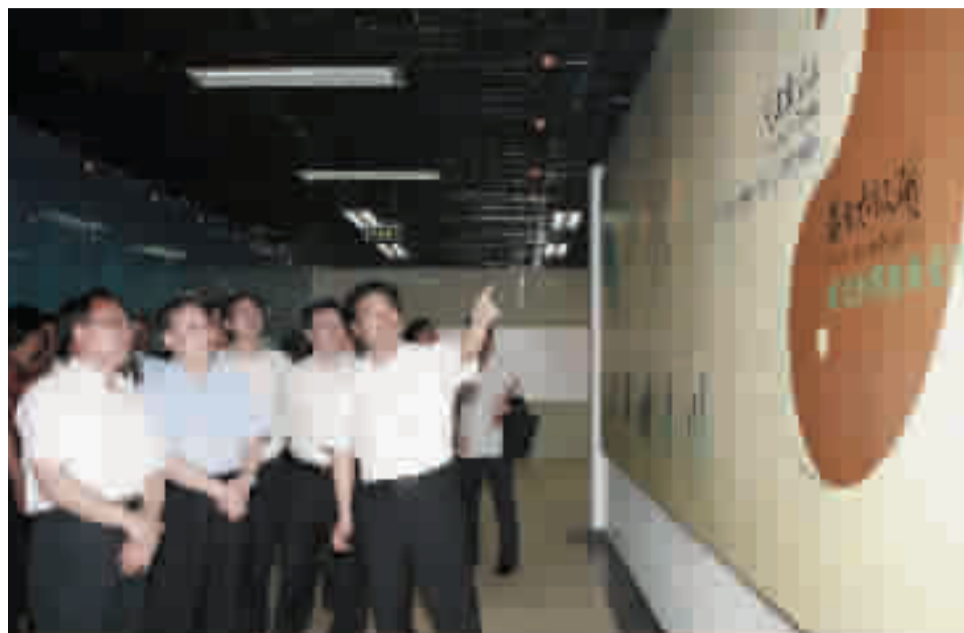
省委书记罗清泉(左二)在市委书记陈天会(左一)等领导陪同下察看太极湖项目规划。

6月5日,省委书记罗清泉实地察看了武当山体育中心、武当大剧院、太极湖新区等一批重点工程项目后,语重心长地说:“要用足用活鄂西生态文化旅游圈政策,把