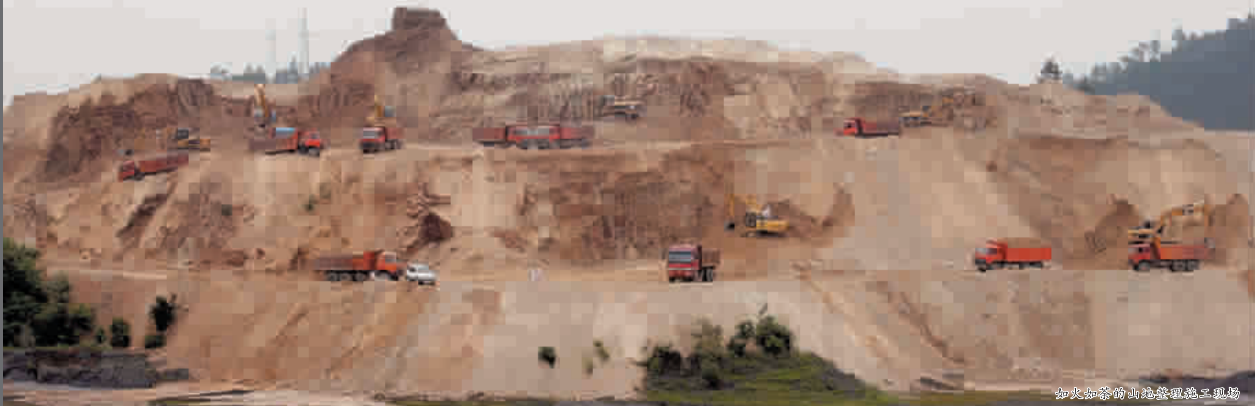
如火如荼的山地整理施工现场