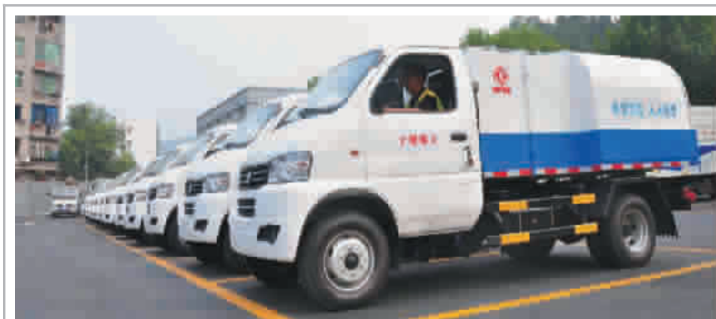
日前,市政园林部门投资160万元新购进22台筒式微型垃圾收运车(如图)。我市西部垃圾处理厂建成投用后,城区垃圾远程转运任务加重。这批垃圾清运车投入使用后,可增强垃圾运载能力,进一步完善城区垃圾收运系统。