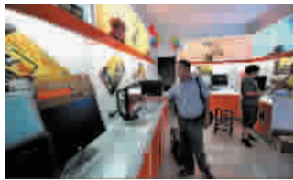
中国超越美国成全球最大个人电脑市场

8月24日,湖北省宜恩县居民在一家电脑商城选购电脑。据市场研究机构国际数据公司8月23日公布的报告,中国今年第二季度超越美国成为全球最大个人电脑市场。季度报告显示,今年4月至6月,中国个人电脑出货量升至1850万台,价值119亿美元,超过美国的1770万台;中国在全球个人电脑市场所占份额升至22%,超过美国的21%。