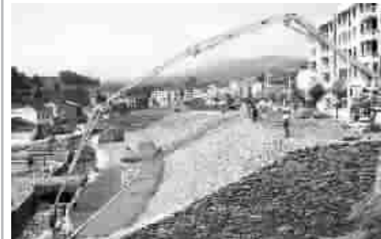
9月8日,施工人员正在利用自动灌浆设备对龙坝镇广场公园场地进行硬化,致力打造竹溪县“后花园”。在竹房城镇建设带建设中,竹溪县把人力、物力和财力向所涉及6个乡镇倾斜,按照规划的蓝图切实推进。