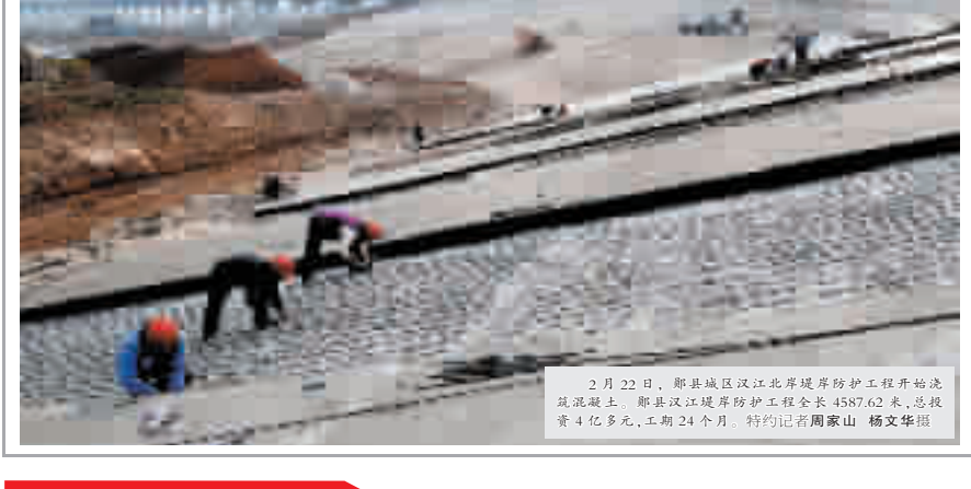
2月22日,郧县城区汉江北岸堤岸防护工程开始浇筑混凝土。图为汉江堤岸防护工程全长4587.62米,总投资4.9亿元,工期24个月。