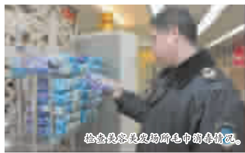
检查美容美发场所毛巾消毒情况。