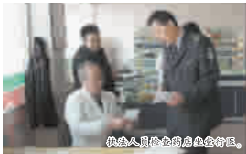
执法人员检查药店坐堂行医。