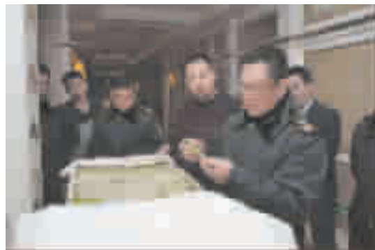
检查宾馆提供的客用化妆品。