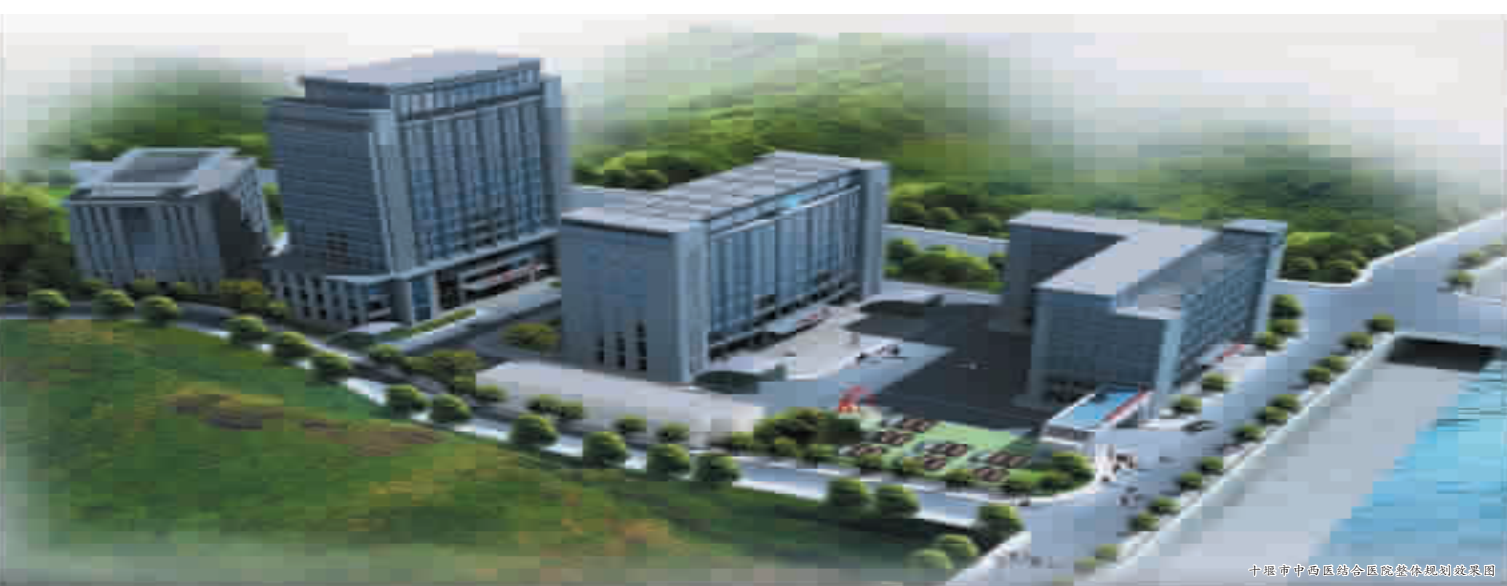
十堰市中西医结合医院总体规划设计图