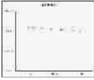
市红十字医院历年住院例均费用呈下降趋势