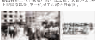
第一机械工业部审批文件

当时我国的汽车工业基础非常薄弱,需要依靠苏联这个“老大哥”的扶持。在技术方面,第二汽车制造厂选址充分征求了苏联专家们的意见,最终筹备组将第二汽车制造厂的厂址选在了武昌地区,并上报国家建委、第一机械工业部进行审批。