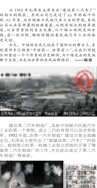
东风汽车发展历程图