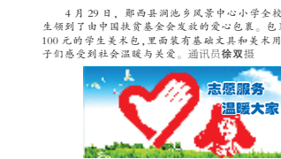
4月29日，郧西一中 扎实开展精准扶贫工作

2019年国家职业教育活动周于5月6日至12日举办，本届活动周以“迎建国七十华诞 展职教时代风采”为主题，该校开展《国家职业教育改革实施方案》专题宣讲是该校“2019年职教活动周”活动之一。该校在“2019年职教活动周”期间还将举办“送文艺下乡”“校园开放日”“师生才艺技能展”等活动，让社会人士、学生家长走进职教感受现代职业教育的特