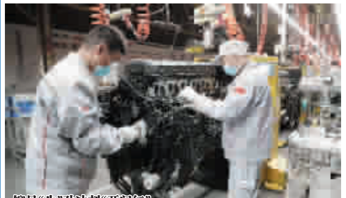
柳足“牛”劲冲刺“开门红”

2月18日,在东风商用车有限公司动力总成新工厂生产线上,工人们正在紧张生产。去年,新工厂在疫情冲击下实现逆势增长,生产发动机8.5万台,变速箱9.8万台,经营额达10.6亿元。开年以来,新工厂继续加大工业机器人以及新工艺的应用,提升中重型发动机和变速箱加工装配能力,铆足“牛”劲冲刺“开门红”。