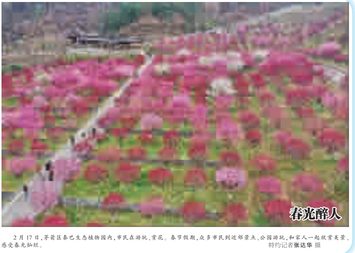
2月17日,茅箭区泰巴生态植物园内,市民在游玩,赏灯。春节假期,众多市民到郊外景点、公园游玩,和家人一起欣赏美景,感受春光灿烂。