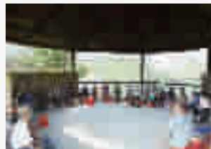
茅箭区纪检监察干部在茅塔乡王家村召开“院子会”了解政策落实情况。

“清零”“销号”行动。2020年以来,共受理涉黑涉恶腐败和保护伞问题线索17件,给予党纪处分2人,组织处理9人。 处分不是目的,更不是最终归宿。在控掉“烂树”的同时,茅箭区纪委监委将注意力放在整个“森林”的健康,坚持标本兼治,一手抓高压震慑不手软,一手抓正本清源不懈怠,用好监督执纪“四种形态”。特别是精准有效运用好谈心谈话等第一种形态,对违规违纪的苗头性和倾向性问题及时约谈提醒,防微杜渐,让“咬耳扯袖,红脸出汗”成为常态。 2020年,该区各级纪检监察机关共运用“第一种形态”处理440人次,占比73.9%。各级党委(党组)综合运用“第一种形态”开展提醒谈话、批评教育143人次。对顶风违纪者,强化通报曝光。去年以来,茅箭区纪委监委点名道姓通报曝光“四风”典型案例43件70人,起到了较好的震慑作用,有效防止了“四风”问题反弹回潮。