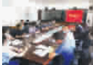
茅箭区纪委监委派出纪检监察组在该区交通运输局监督扫黑除恶专项斗争工作。

在全区纪检监察系统深入开展“六气”暨作风整顿活动,从纪委监委班子抓起,带头查摆剖析六个方面的问题。组织全区党员干部积极参加纪委“空中课堂”学习,市纪委知识能力线上学习和测试。在纪委监委机关开展年轻干部纪法讲堂7次,24名干部作交流发言。组织参加上级培训69次,其中参加中国纪检监察学院培训35人次,实现委机关干部全员参训;参加省纪委培训2人次,市级培训32人次。组织本级培训班2期,培训干部96人次。在系统内开展作风月考,对问题线索处置、开展日常工作监督等任务按月考核排名,督促履职尽责。制定《茅箭区纪检监察系统干部监督办法(暂行)》等五项工作制度,对全系统79名纪检监察干部建立廉政档案,动态更新3次,开展家访30余人次。 风清气正好扬帆,砥砺奋进谱新篇。茅箭区纪委监委将以新的精神状态和奋斗姿态,推动全面从严治党向纵深推进,全力营造风清气正的政治生态,为茅箭区“十四五”开好局,起好步提供有力保障。