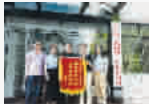
企业负责人向茅箭区纪委监委派出第三纪检监察组送锦旗。