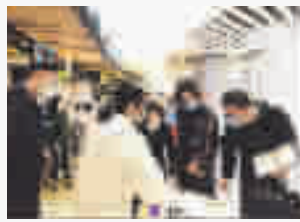
纪检监察组深入辖区商超门店察看疫情防控措施落实情况。

底,受理和处理11件涉企问题线索,追责问责4人。结合该区开展的“双千”活动,与区工商联、科经局、商务局等部门对接,筛选全区有党建基础的20家民营企业开展清廉示范民营企业创建工作。 为打好脱贫攻坚攻坚战,茅箭区纪委监委以“四个不摘”为目标,开展全覆盖明察暗访10次,下发整改交办函12份。深入14个贫困村、105户贫困户,5个产业基地和扶贫项目现场实地检查,督促相关单位整改3大类6个问题。紧盯不愁吃不愁穿及义务教育、基本医疗、住房安全有保障等核心指标跟进监督、精准监督、全程监督,确保如期高质量打赢脱贫攻坚战。 2020年,茅箭区纪委监委共查处扶贫领域违规违纪问题41个,给予党纪政务处分17人,组织处理59人。全区建档立卡户2397户7127人,已全部实现脱贫。