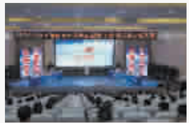
聚焦关键问题，优化营商环境。