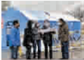
竹山县纪检监察干部顶风冒雪督查交通卡点值勤情况

2020年3月4日,竹山县在全市率先实现新冠肺炎疫情防控“三清零”。 为守护好堵河碧水,竹山县印发了《关于进一步加强全面禁捕渔民退捕转产安置保障工作实施方案》,按照“一船一档案、一船一协议、一船一确认”,规范化常态化推进禁捕退捕工作。全县9个涉水乡镇共封存上岸“三无”船只518艘,拆解木筏、竹排、塑胶船等127艘,水上“三无”船只清理干净,给予党纪政务处分1人。 为贯彻习近平总书记关于制止餐饮浪费的重要指示批示精神,竹山县纪委监委把节约粮食、制止餐饮浪费作为落实中央八项规定精神、纠治“四风”的重要方面,纳入纪律监督、监察监督、派出监督、巡察监督,聚焦公务活动用餐、党政机关和企业事业单位食堂等重点场所,紧盯超标准、大吃大喝、违规饮酒等重点问题,通过明察暗访、专项检查、随机抽查、突击检查等方式,让勤俭节约理念进机关、进企业、进乡村、进家庭、进学校。目前,该县先后深入30个单位开展监督检查,下发4期“光盘行动”落实情况通报。