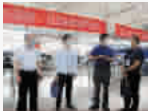
竹山县纪委监委监督检查组深入湖北蓝狮服饰有限公司,为企业解难题

官渡镇在镇村小微权力监督上下功夫,坚持问题导向,梳理了21项“小微权力”清单,并对这些清单存在的廉政风险进行分级分类监督。 楼台乡围绕“小微权力”运行存在的风险点,以“蓝、黄、橙、红”4色进行风险预警,建立风险权责体系、评估体系、预警体系、监督体系、治理体系等5大体系,对6大领域34项廉政政策建立“小微权力”权责清单。 …… 创建“小微权力”监督试点,规范“小微权力”运行体系。去年共查处“小微权力”腐败和作风问题89个,追责问责101人。