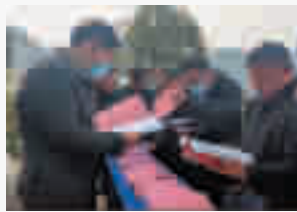
竹山县纪委监委组织开展“业务拉练”活动

员干部、教师、学生、军人、农民、警察、医生、公交司机等各界人士。 为将党纪普法宣教“触角”延伸到村组院落,该县纪委监委通过县、乡镇、村三级联动,精心编排廉政小品,借助“云”媒体平台、村村响广播,将党纪党规、本土鲜活事例搬上舞台,走进千家万户,让廉政之声飞入寻常百姓家。纪检监察干部人人争当“宣传员”,讲好正风反腐“竹山故事”,2020年,全县纪检监察系统在市级以上主流媒体发稿579篇,同比增长78.7%。