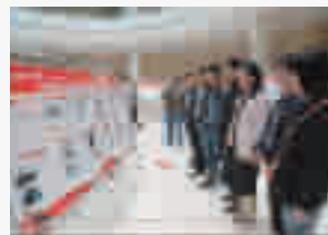
十堰市党风廉政教育实践基地成果巡回展走进竹山,该县干部群众踊跃参观

做到不越“党纪警戒线”、不碰“政治指令线”,不触“纪法高压线”。该县是秩序分时段组织副县级以上干部、各乡镇和县直单位领导班子成员及干部职工、“两代表一委员”及特约监察员等共7500余人次在泰巴文化艺术中心参观十堰市党风廉政教育实践基地,将违纪违法者的惨痛教训转化为知敬畏、存戒惧、守底线的行动自觉。 “暖心回访”靶向施策、因人而治,让受处分的干部重燃干事创业的斗志。竹山县纪委监委按照干部管理和审批处分权限,对近两年受处理处分人员,实行分层次、“一对一”回访。截至去年12月底,该县已对408名党员干部开展暖心回访。